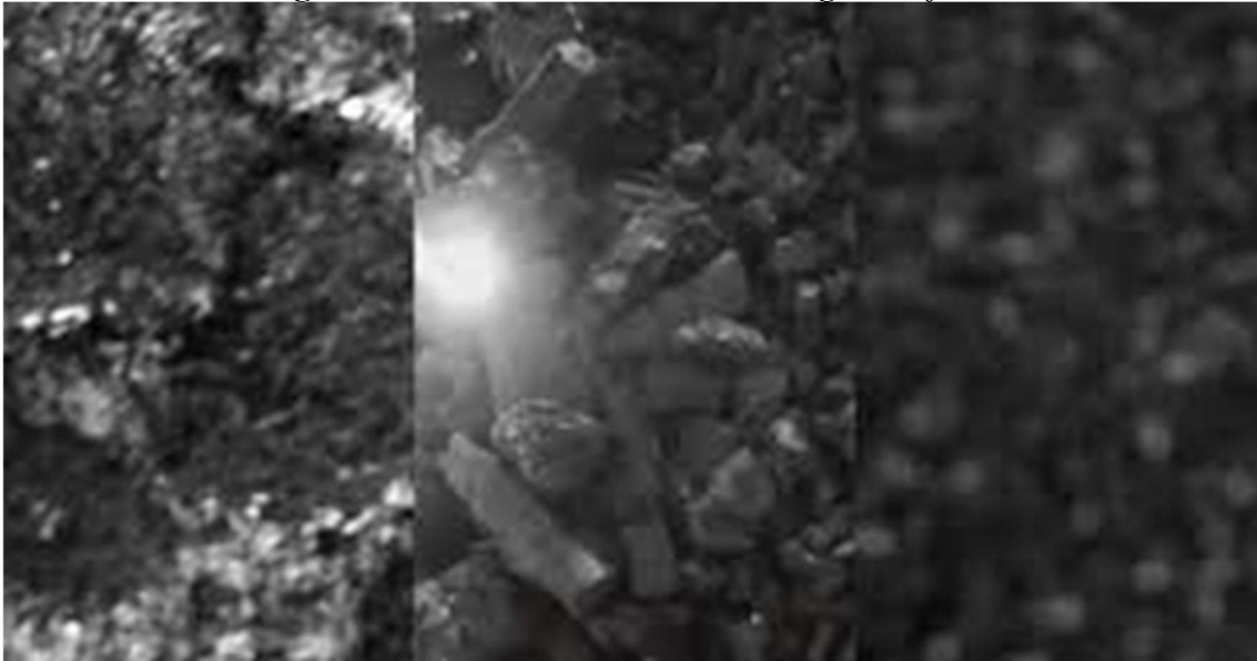
Figura 4. Carvões-sombra de uma imagem do filme

Apreendem fenomenologicamente os critérios de reagrupamento deste real, para os integrarem como conceito constitutivo, e os nomearem linguagem universal, espacialmente, como a forma materializada do acontecimento. (Figura 4).