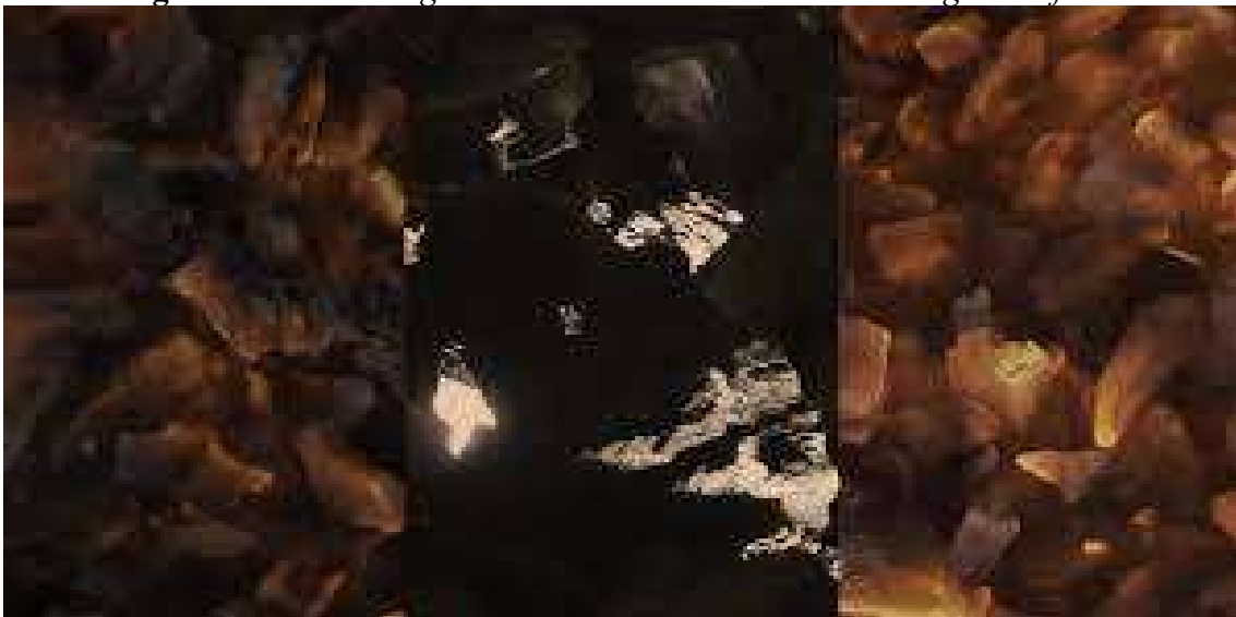
Figura 3. Carvões vegetais e minerais a arder de uma imagem do filme

visual do tempo que queria tocar, mas também de outros tempos suplementares” 19 (ibidem), onde se inclui a passagem de sistemas heterogêneos, que tem mais do que uma fase na transição de sistemas, que não se podem aglutinar, porque “a imagem arde. Arde com o real, a que num dado momento se aproximou” 20 (ibidem), arde “pela intencionalidade que a estrutura, pela enunciação, até pela urgência que manifesta” 21 (ibidem), “para a destruição” 22 (idem, p. 52). Arde pelo “brilho, isto é, pela possibilidade visual aberta” em que ela própria se faz desaparecer, e arde porque o “carvão é luz” (Castro, 2021). E arde “pelo seu intempestivo movimento [...], pela dor de que provém [...], arde pela memória [...], e arde para sobreviver” 23 (Didi-Huberman, 2007, p. 52), para figurar como imagem incendiada. (Figura 3).