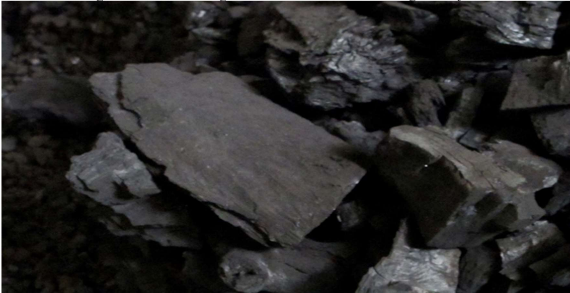
Figura 1. Carvões vegetais e minerais de uma imagem do filme

criativa” 10 (Deleuze, (2003) [1986], p. 270) e revele o segredo da sua existência 11 , da sua enformação, da sua verdadeira natureza, para que estas “[...] sejam vistas, interrogadas no nosso tempo” 12 (Didi-Huberman, 2007, p. 39).