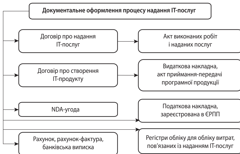
Рис. 3. Документальне забезпечення процесу надання ІТ-послуг