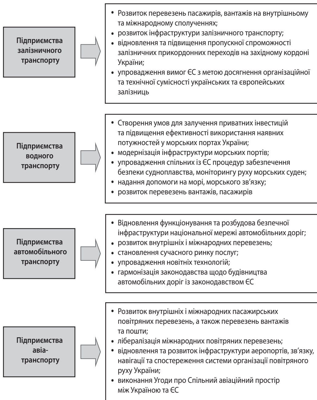
Рис. 3. Основні напрямки розвитку та відновлення транспортних підприємств в умовах війни та в повоєнний період