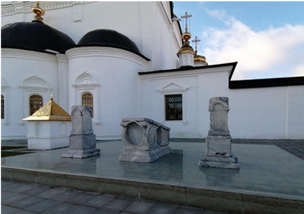
Рис. 1. Каменные надгробия на территории Софийского двора

Также сведения о погребениях близ главного собора епархии содержат Тобольские епархиальные ведомости, прежде всего опубликованные в «Ведомостях» некрологи лиц духовного звания.