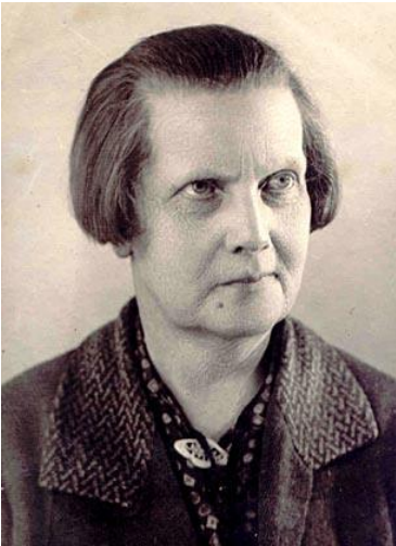
Рис. 2. Проскурякова Екатерина Федоровна (1873–1942 гг.)

о педагогических обществах, съездах и прочем. Журнал издавался с октября 1911 г. по август 1916 г. (Антишин, 2023: 116)