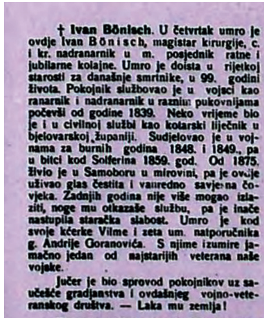
Slika 2. Obavijest o smrti u: Samoborski list , god. VII, br. 36, 12. 9. 1912.

( https://www.samobor.hr/repozitorij/1912-36.pdf )