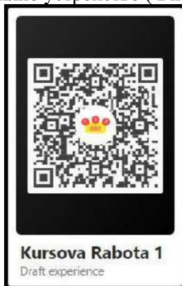
Фиг. 1. QR код

За всяко преживяване се генерира автоматичен QR код, който показва в реално време дигитално създадената добавена реалност, след като бъде сканиран с мобилно устройство ( Фиг. 1 ).