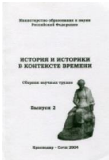
Рис. 3. Обложка в 2004-2012 гг.