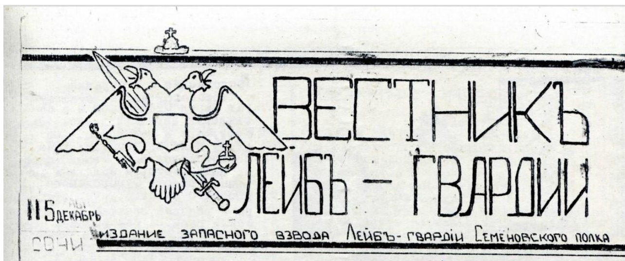
Рис. 1. Титульная страница «Вестника Лейб-гвардии». 1992. № 5

В 2003–2021 г. обложка журнала менялась 3 раза (См. Рисунки 2, 3, 4 ).