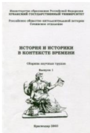
Рис. 2. Обложка в 2003 г.

В 2003–2021 г. обложка журнала менялась 3 раза (См. Рисунки 2, 3, 4 ).