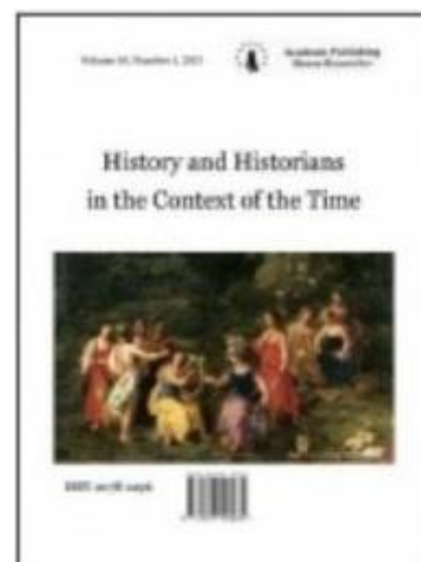
Рис. 4. Обложка в 2013-2021 гг.

В 2021 г. издательство, которое издавало «History and Historians in the Context of the Time», в связи с изменением геолокации получило название Cherkas Global University Press. В связи с этим и обложка журнала изменилась в очередной раз ( Рисунок 5 ).