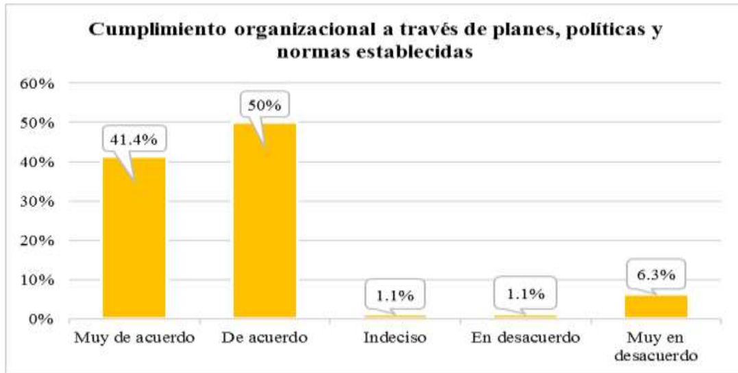
Figura 1. Cumplimiento de planes, políticas y normas.

Se evaluó la importancia de contar con un manual de procedimientos administrativos. Con la información que se obtiene al respecto se considera si dicho manual constituye una práctica considerable para el logro de los objetivos institucionales. Al respecto, los resultados obtenidos se muestran en el figura 2.