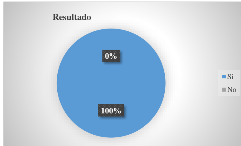
Figura 3. ¿Considera que la institución necesita emplear algún o algunos indicadores para medir el desempeño organizacional?

En cuenta a posibilidad de emplear nuevos indicadores que permitan evaluar de manera efectiva el desempeño organizacional el 100% de los funcionarios están de acuerdo en que este sería un factor clave que beneficiaría en gran medida a todos los niveles jerárquicos que componen la institución.