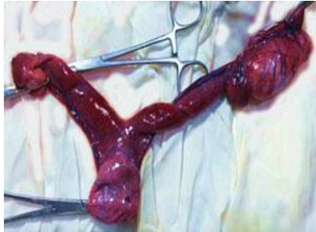
Figura 4. Útero con colecta leve, se observa ovario derecho de apariencia normal, estructura similar a un testículo en la ubicación anatómica del ovario izquierdo

posible avanzar en el proceso diagnóstico debido a que los laboratorios de genética cerraron sus puertas durante la pandemia. En evaluaciones clínicas posquirúrgicas el paciente se encontró en estado óptimo de salud.