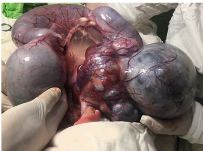
Figura 1. Se aprecia útero con piometra de gran tamaño

Hallazgos anatómicos compatibles con piometra en un canino macho que presenta criptorquidia bilateral, dentro de su abdomen órganos reproductivos de una hembra, compatible con pseudohermafroditismo y tumor de células de Sertoli. No se realizaron estudios genéticos debido a dificultades durante la pandemia.