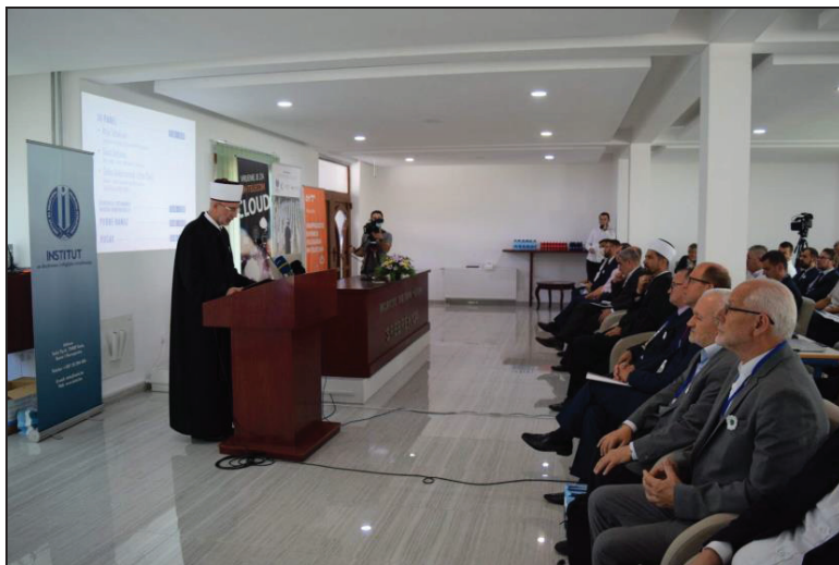
Prilog 2. Obraćanje tuzlanskog muftije Vahid-ef. Fazlovića.

Rasvjetljavanje uloge alima Srebrenice u duhovnom i društvenom životu Bošnjaka, a što je cilj ove naučne konferencije, jeste istovremeno i odavanje priznanja svima njima, ali i ispunjavanje dijela našeg trajnog duga prema Bošnjacima u Srebrenici, kazao je Vahid-ef. Fazlović, muftija tuzlanski. Istakao je da ovaj naučni skup predstavlja vrijedan doprinos memorizaciji genocida, a posebno iz razloga što je predviđeno predstavljanje imama šehida genocida nad Bošnjacima međunarodno zaštićene zone Srebrenica, u kojoj su oni, suočeni s teškim i neizvjesnim prilikama, u našem narodu obavili iznimno značajnu ulogu. Muftija Fazlović je podsjetio da je Srebrenica iznjedrila alime kojima u redovima bosanske uleme pripada visoko mjesto.