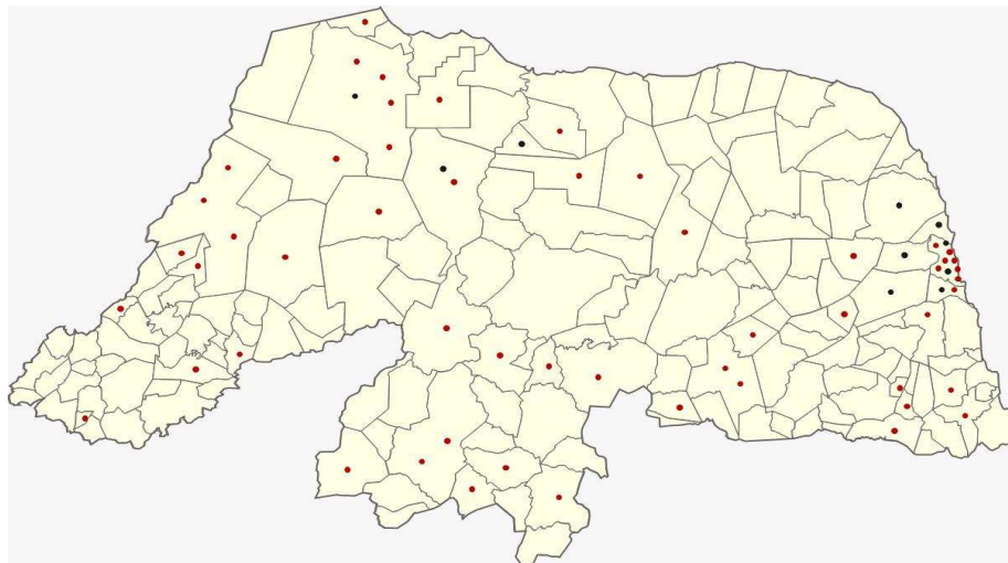
Figura 1. Distribuição geográfica das Escolas Estaduais de Educação Profissional e CEEP no Rio Grande do Norte