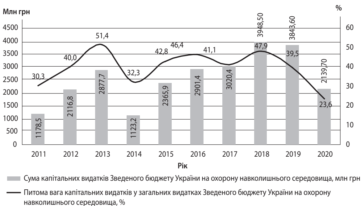
Рис. 2. Фінансування капітальних видатків Зведеного бюджету України на охорону навколишнього середовища