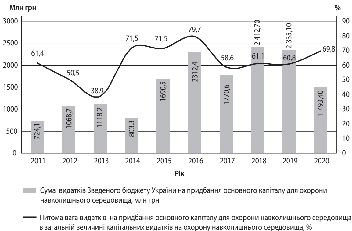
Рис. 3. Фінансування видатків Зведеного бюджету України на придбання основного капіталу природоохоронного спрямування

нинішніх умов бюджетної дефіцитності нарощення інвестиційних вливань у природоохоронну сферу на пряму пов'язане з диверсифікацією джерел фінансування проектів екологічного спрямування за рахунок інвестицій урядів іноземних держав, міжнародних фінансово-кредитних організацій і приватних підприємницьких структур. Водночас досягнення даної цілі залежить від удосконалення економічного механізму природокористування як на загальнонаціональному, так і на місцевому рівні в частині планування, фінансування та стимулювання публічних видатків на природоохоронні цілі, а також залучення фінансових ре-