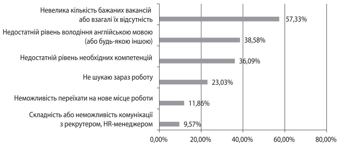
Рис. 2. Труднощі, з якими зіткнулися респонденти під час пошуку нової роботи [6]