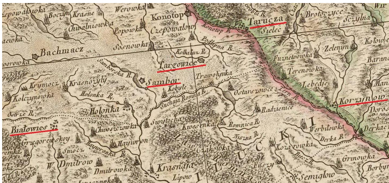
Рис. 3. Фрагмент карты Риччи Занони 1772 года с нанесенными укреплениями несуществующих населенных пунктов

Другие древнерусские городища, расположенные в этом регионе, почему-то не попали в поле зрения французского картографа. Городище летописного города Попаш вблизи Недригайлова имеет такую же отметку, но не имеет собственного названия. Оно было хорошо известно роменчанам, которые попытались несколько раз его осадить. Другое городище, детинец летописного города Вяхань, было решено не осаждать до решения вопроса с делимитацией границы. Оно не было нанесено на карту, как и другие укрепления раннего железного века и древнерусского времени.