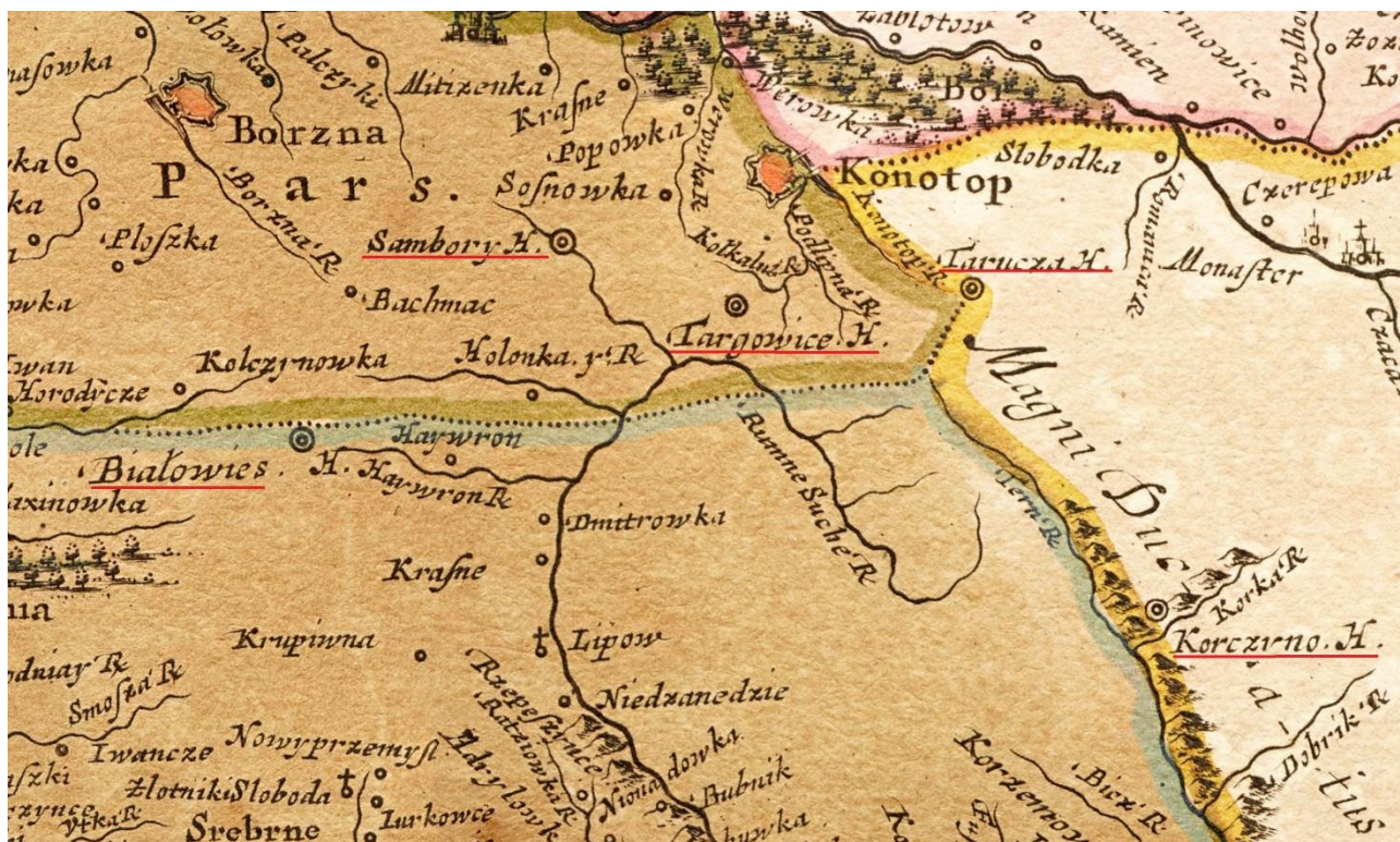
Рис. 2. Фрагмент карты Гийома Левассера де Боплана с нанесенными городищами междуречья Сулы и Сейма

памятником. Таким образом, первое достоверное упоминание городища Торговица относится к первой половине XVII в. Оно упоминается не как центр волости, а как один из географических ориентиров в определении границ бортного ухода.