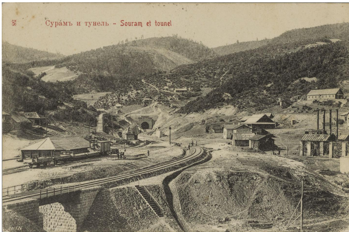
Рис. 2. Сурамский тоннель ЗКЖД. Открытка, после 1900 г.