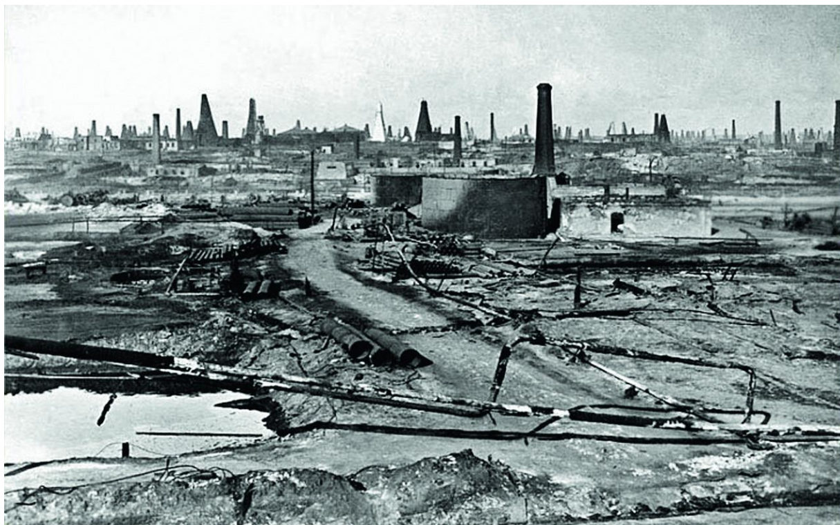
Рис. 1. Балаханский нефтепровод. Не ранее 1900 г.

Все эти предварительные постройки показали тем не менее, что строительство постоянно действующего нефтепровода (или керосинопровода, как тогда называли этот тип построек) окупается быстро при условии постоянной перекачки нефти. Ни речной транспорт, ни железная дорога не давали такого экономического эффекта.