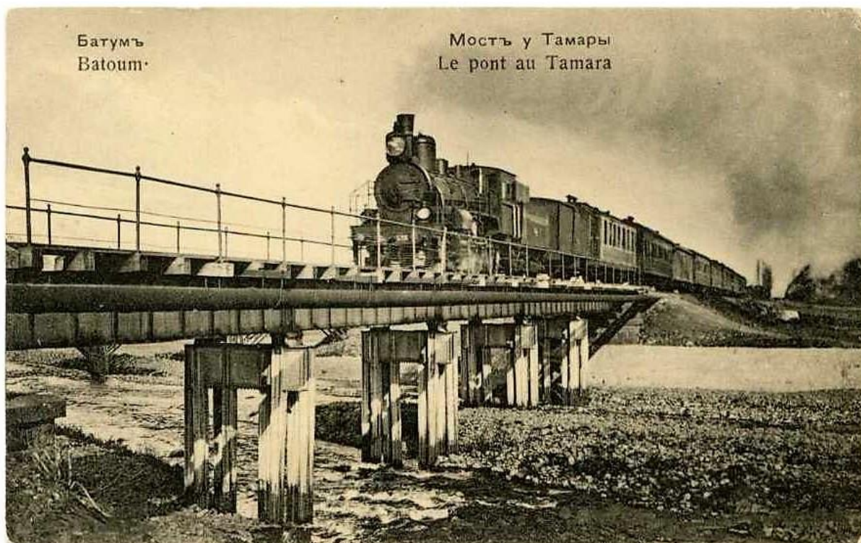
Рис. 3. Мост с керосинопроводом в Батуме. Открытка, 1910 г.

а также сложные технические устройства, такие как железнодорожные вагоны (цистерны и пассажирские), различные объекты инфраструктуры – мосты, тоннели, переезды (Рисунок 3).