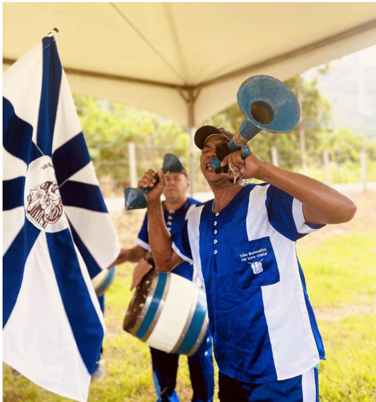
Foto 22: Mestre da Banda São Benedito de Boa Vista. A foto registra o asfalto ao fundo, cortando as paisagens verdes.

Informação técnica: Iphone 13 em modo retrato.