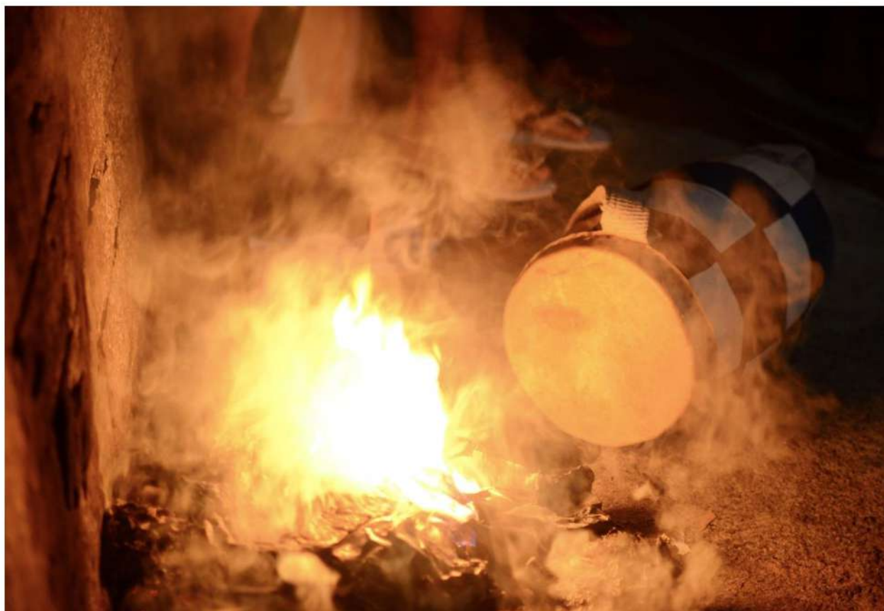
Foto 3: Aquecer de tambores e pés no chão. Informação técnica: Nikon D5100 lente Sigma 18-250mm F3.5-6.3.