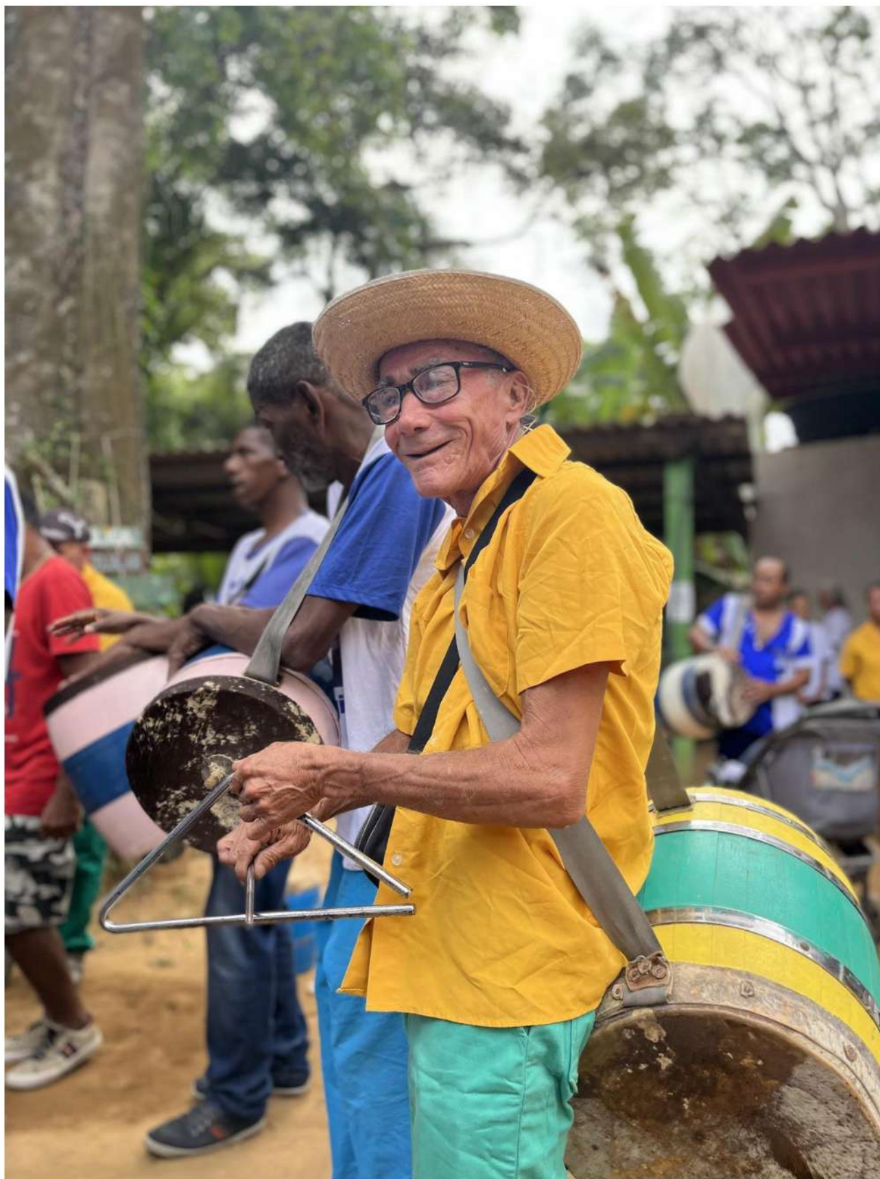
Foto 11: Momento de concentração das bandas de congo dos municípios da Serra, Cariacica e Viana. Informação técnica: Iphone 13 em modo live .