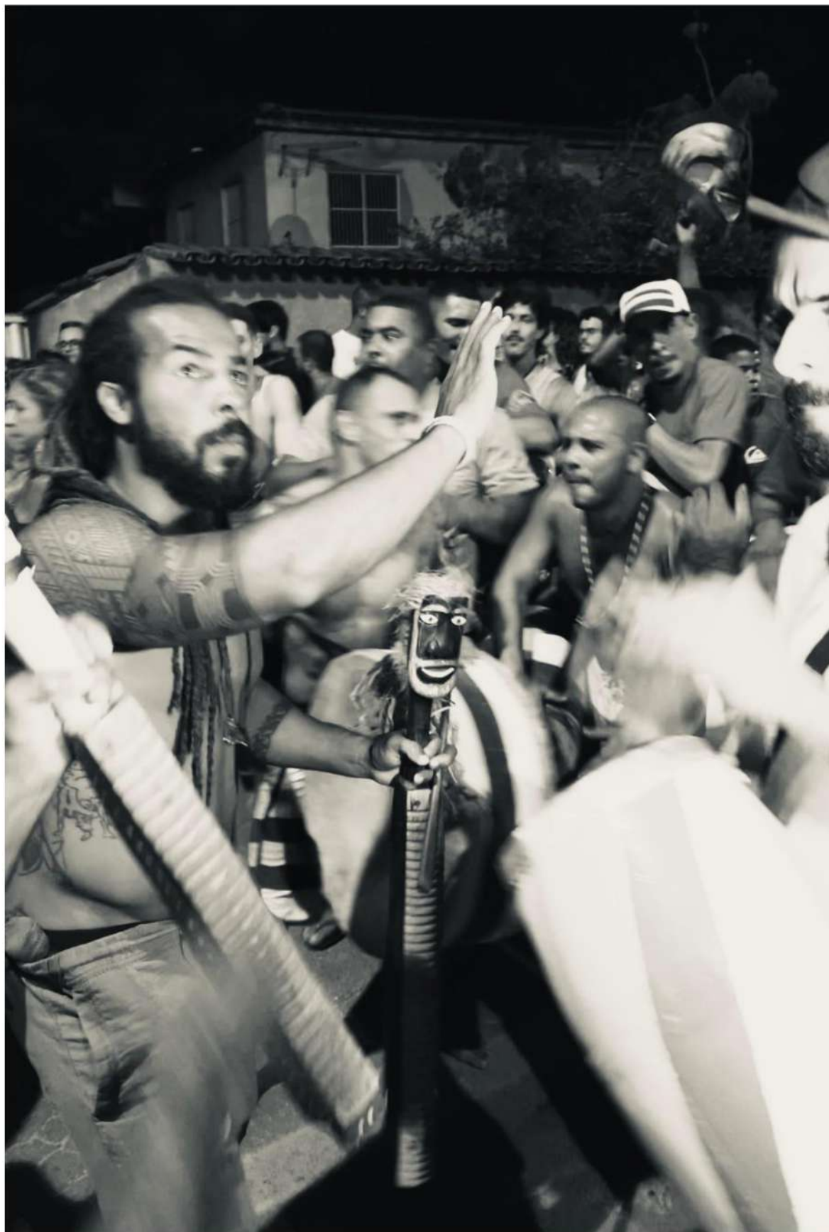
Foto 9: Comandos de Rhullit e entrega de uma banda de congo integralmente masculina. Instrumento afro-indígena “casaca” em foco. Informação técnica: Iphone 13 em modo retrato. Preto e Branco.