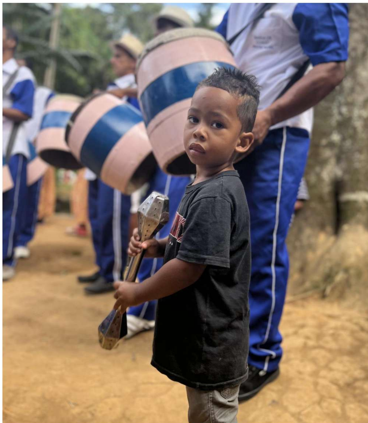
Foto 20: Tradição desde a infância. Informação técnica: Iphone 13 em modo retrato.