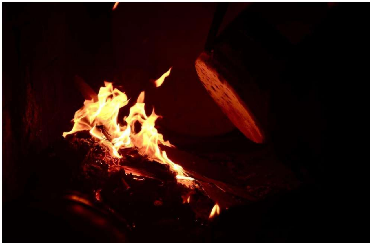
Foto 1: Aquecimento de tambores na fogueira para afinação no congo de Manguinhos, em abril de 2022. Festa de Derrubada do Mastro de São Sebastião.

Informação técnica: Nikon D5100 lente Sigma 18-250mm F3.5-6.3.