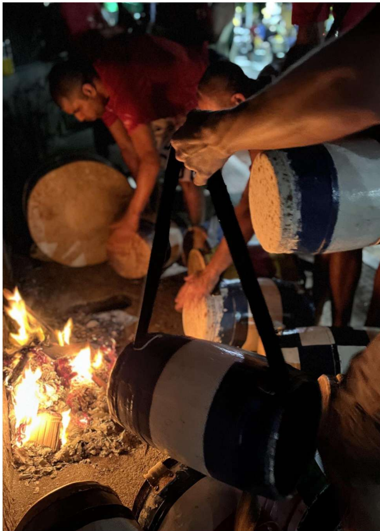
Foto 7: Aquecer de tambores na fogueira e teste de afinação coletiva. Informação técnica: Iphone 13 em modo retrato.