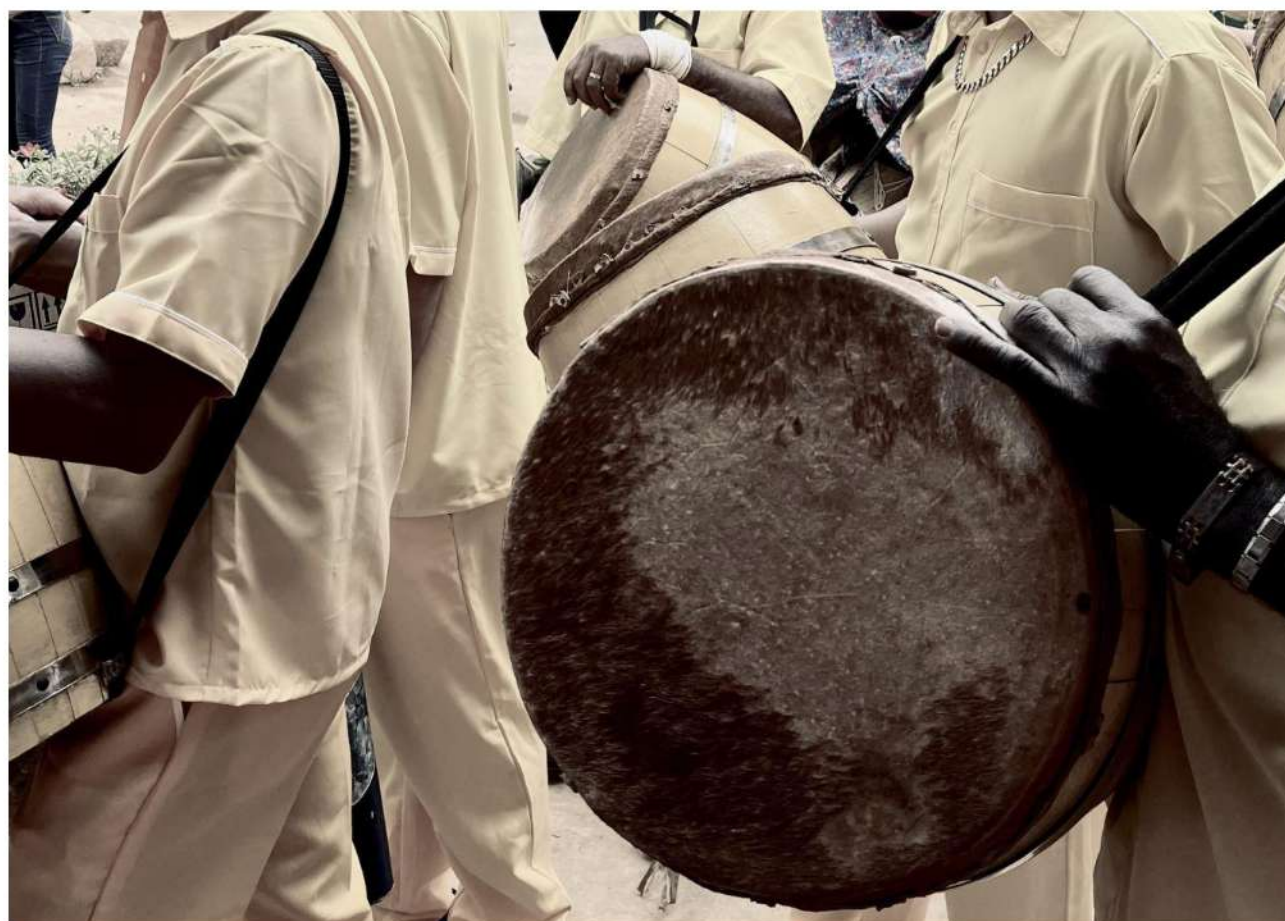
Foto 13: Cenas encantadas das mãos e tambores. Informação técnica: Iphone 13 em modo retrato.