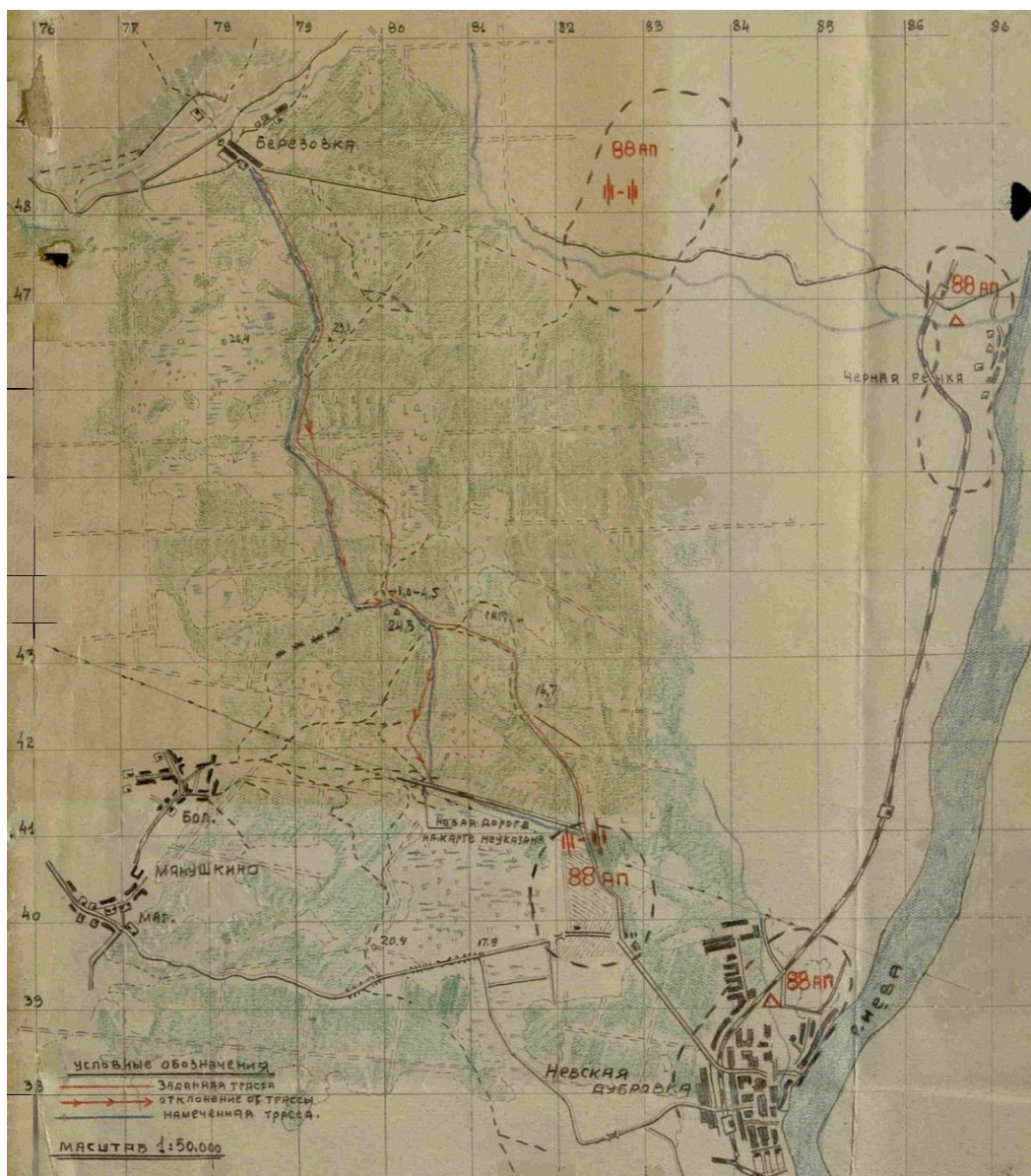
Рис. 4. Боевые порядки 88-го ап 80-й сд по состоянию на 3 ноября 1941 г. (ЦАМО. Ф. 1228. Оп. 1. Д. 8. Л. 146)