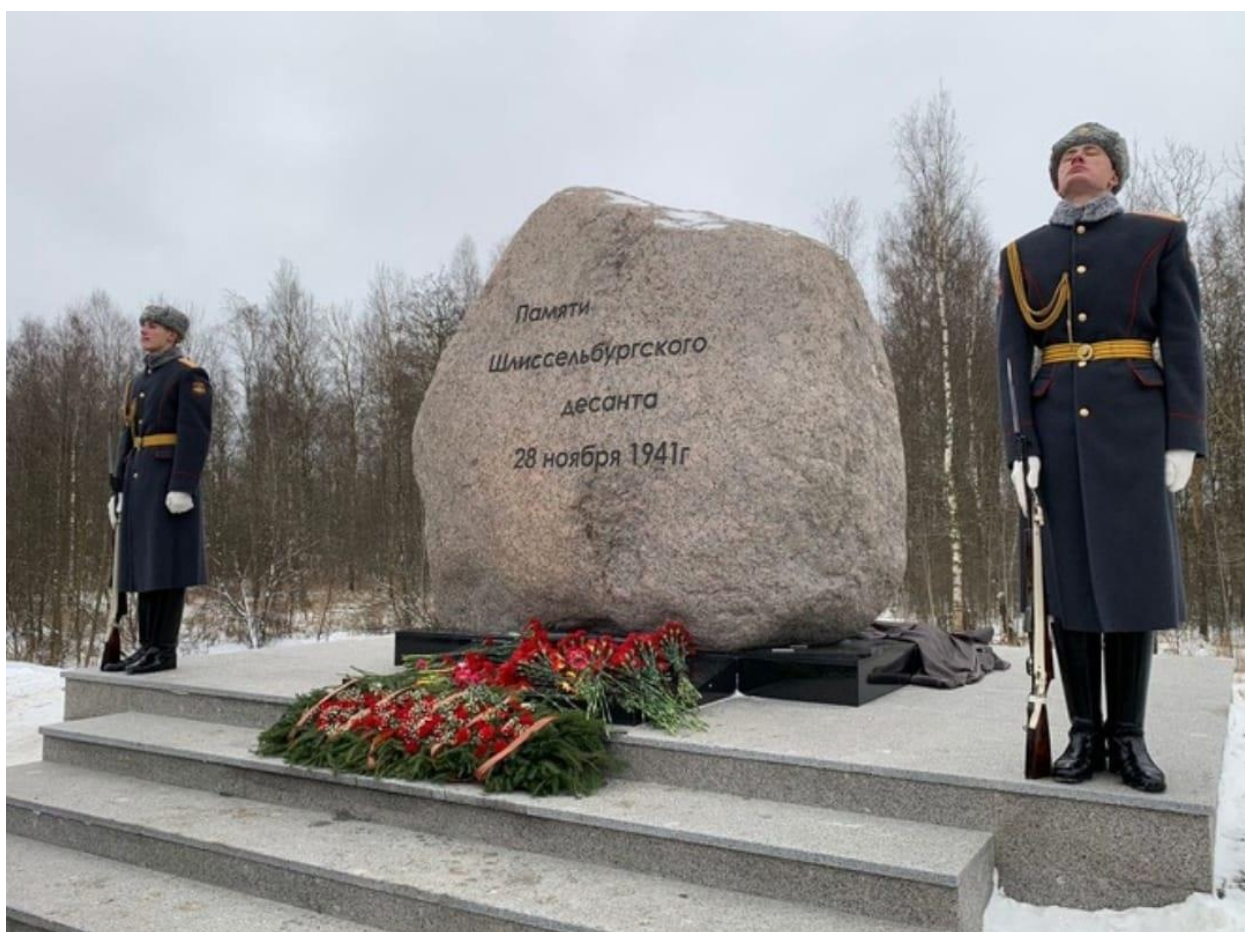
Рис. 6. Открытие памятника участникам Шлиссельбургского десанта. 29 ноября 2015 г.

Впоследствии наступление 28 ноября 1941 г. было названо Шлиссельбургским десантом 28 ноября 1941 г. (участниками которого были 80-я сд и 1-й отдельный лыжный полк), а в честь этого события 29 ноября 2015 г. был установлен памятник (Рисунок 6).