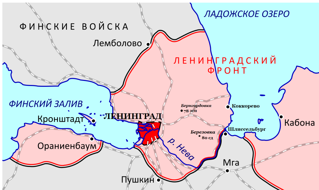
Рис. 3. Схема мест дислокации 78-го зсп и 80-й сд