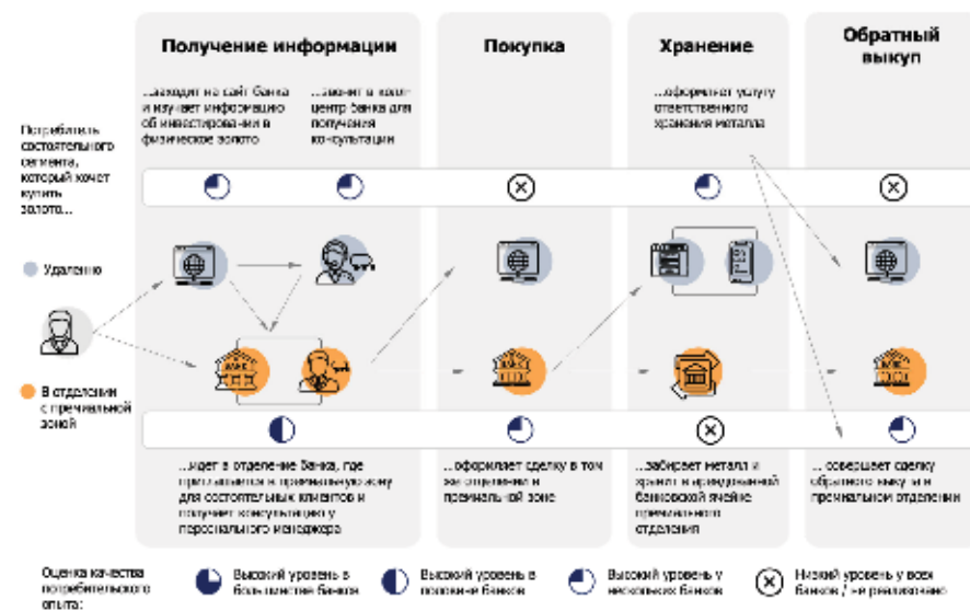
Fig.2. Customer experience map for the mass segment in the process of investing in gold through unallocated metal account