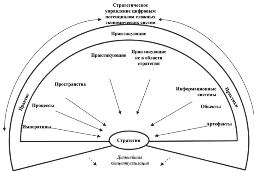
Адаптировано авторами по материалам [26]

Концептуальная область цифрового платформенного стратегирования представлена на рис. 3.