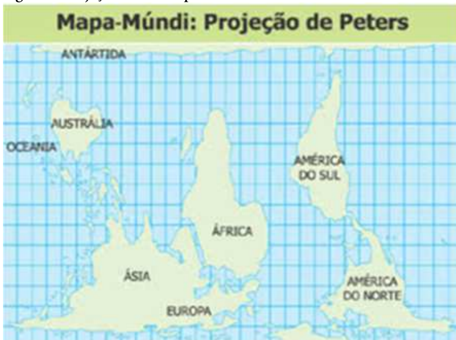
Figura 1. Projeção Peters adaptada