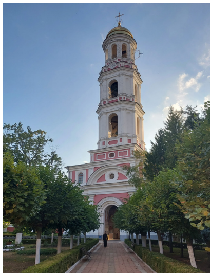
Рисунок № 3. Вид на колокольню Ново-Нямецкого монастыря.

Со времени своего основания Ново-Нямецкий (Кицканский) монастырь стал не только одним из религиозных центров Бессарабии, но и местом притяжения для тех, кто хотел в его лоне посвятить себя духовному служению. В этом плане болгары и гагаузы Буджака не составляли исключения, проявив себя в различных сферах развития и деятельности этой святой обители.