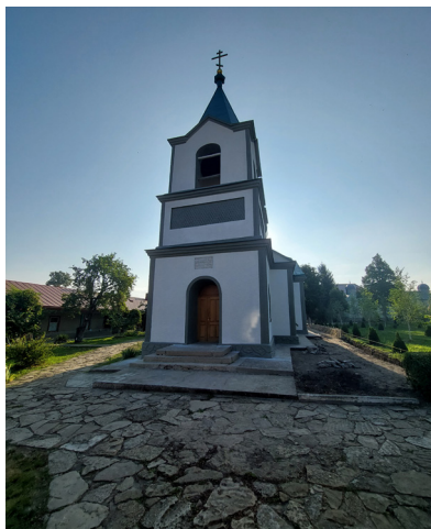
Рисунок № 1. Свято-Николаевская церковь Ново-Нямецкого монастыря.

Устроителями этой обители были молдавские монахи, вышедшие из Нямецкого монастыря, который имел общее управление с Секульским монастырем. Следует отметить, что причиной, заставившей иноков покинуть родную лавру, состояла в указе князя Молдавского княжества — Александра Иоанна Кузы (от 1859 г.), объявлявшем государственными земли, ранее принадлежавшие Нямецко-Секульской святой обители [Гурий, 1911. С. 7]. Братия монастыря «с глубокой скорбью и болью в сердцах взирала на это невообразимое бедствие», в следствии чего нямецкие иноки стали постепенно покидать монастырь, а затем и Молдавское княжество. Одни иноки нашли духовное спасение на Афоне, а другие «по совету духовных отцов лавры, перешли тайно через прутскую границу в Бессарабию, под покров православного Императора России...» [Там же. С. 12].