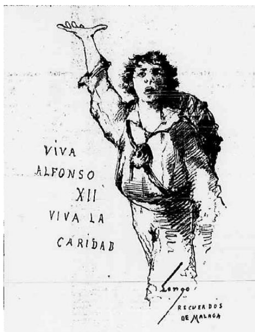
Imagen 4: LENGUA, Horacio (1885): «Viva Alfonso XII. Viva la caridad. Recuerdos de Málaga», El Día. Número extraordinario , 27-I, h. 2v. c. 2-3.