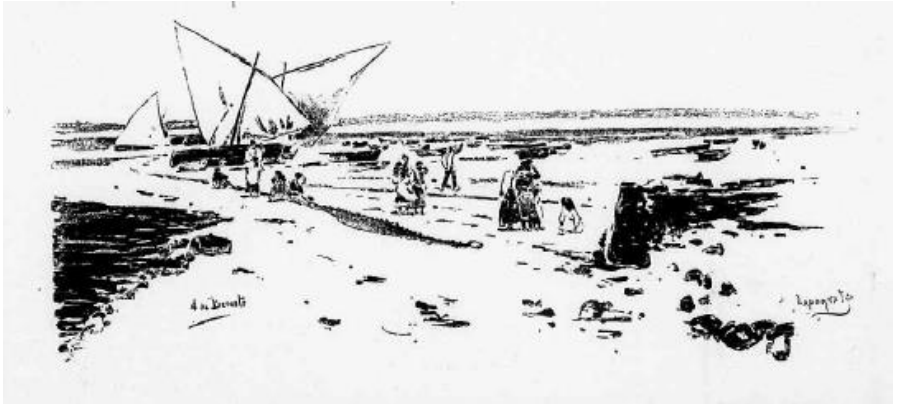
Imagen 3: BERUETE, Aureliano de (1885): [«Una playa»], El Día . Número extraordinario, 27-1, h. 2r. 1-4.