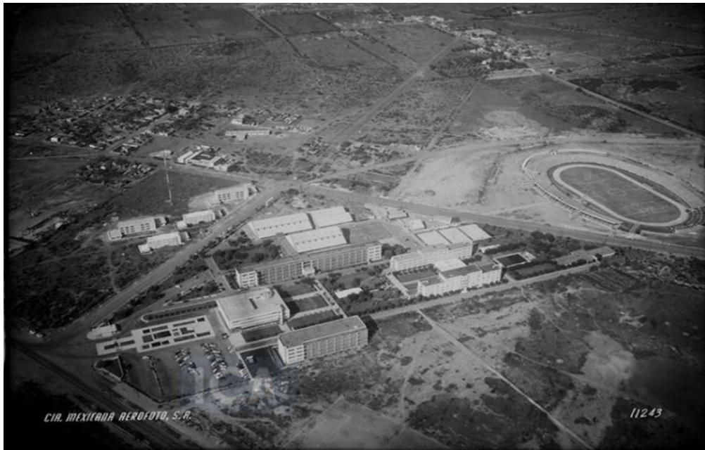
Imagen 2. Campus del Tecnológico de Monterrey, ca. 1954.