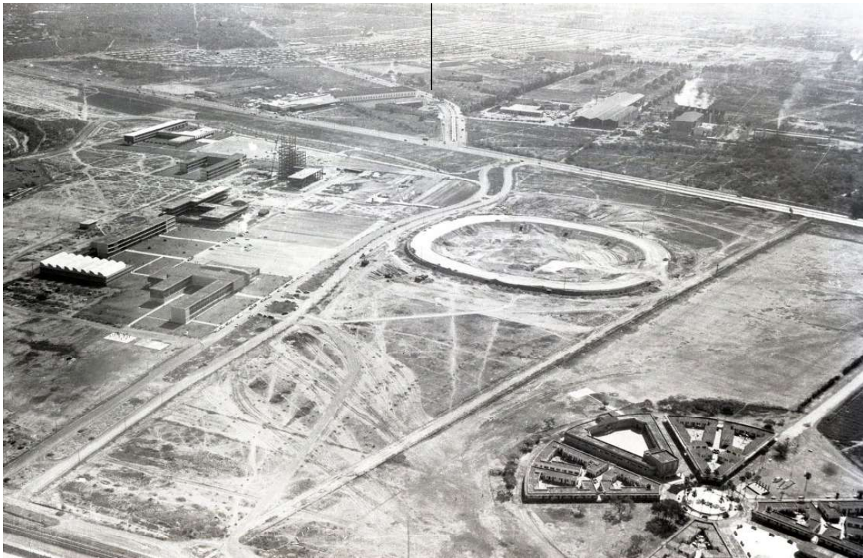
Imagen 6. Vista aérea de la CUNL en construcción (segunda etapa), ca. 1960. Se observa la torre de Rectoría en proceso de edificación y la preparación del terreno para el Estadio Universitario.