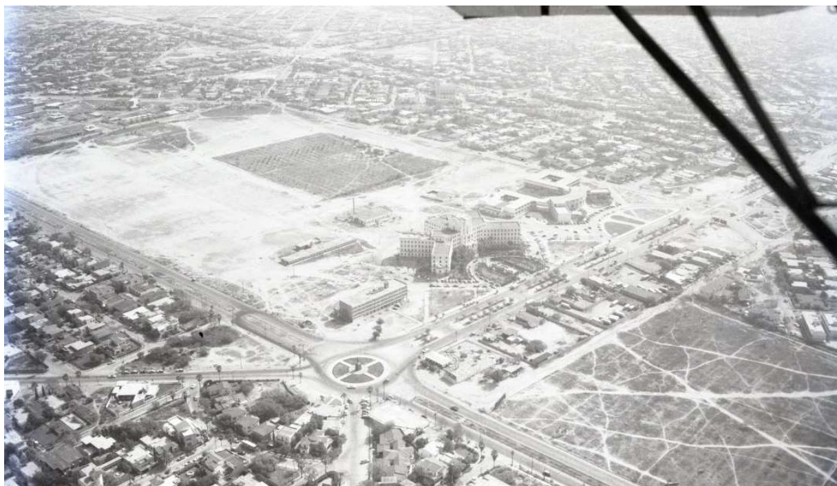
Imagen 1. Terreno colindante con el Hospital Civil “José Eleuterio González”, edificación central, ca. 1960. En la imagen se pueden observar los inmuebles de la Facultad de Medicina (derecha) y la Casa de la Enfermera (izquierda) para la escuela de Enfermería. Con el tiempo se conformaría ahí el Área Médica de la Universidad Autónoma de Nuevo León.

Según hace constar la prensa de la época, tanto el gobernador como miembros de la comisión se entrevistaron con autoridades de la Federación y con el secretario de Educación Pública (SEP), Octavio Véjar Vázquez, durante una visita de éste a la ciudad en abril de 1942, para la solicitud de presupuesto inicial —un aproximado de tres millones de pesos— para emprender las obras tanto de la Normal como de la ciudad universitaria. Sin embargo, a juzgar por la ausencia de referencias al proyecto en los dos últimos informes de gobierno de Salinas