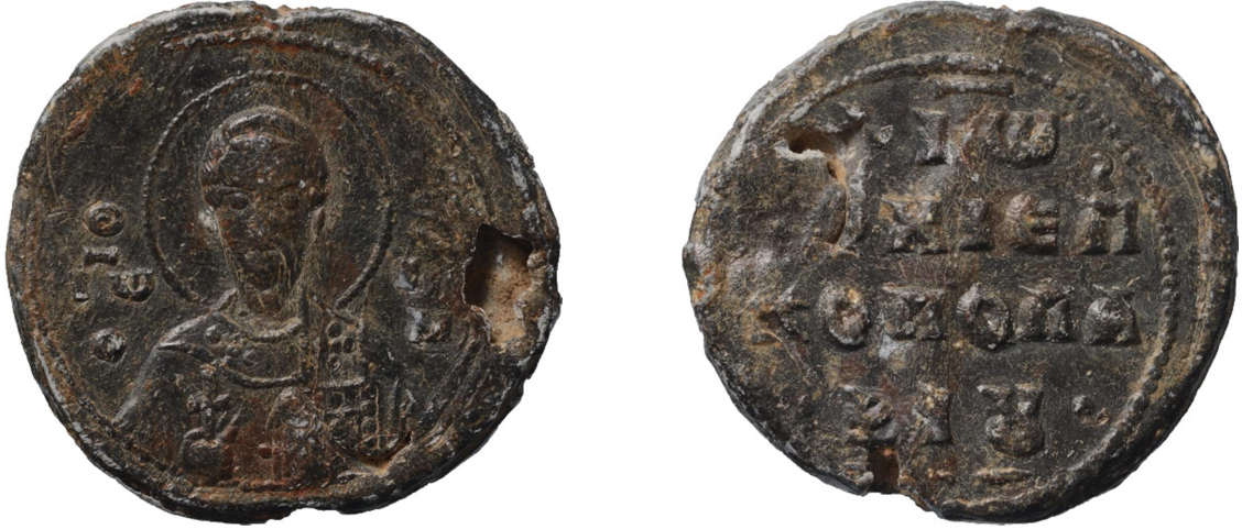
Figür 3: Parion Başpiskoposu Ioannes'in kurşun mühürü (Parion Kazı Arşivi)