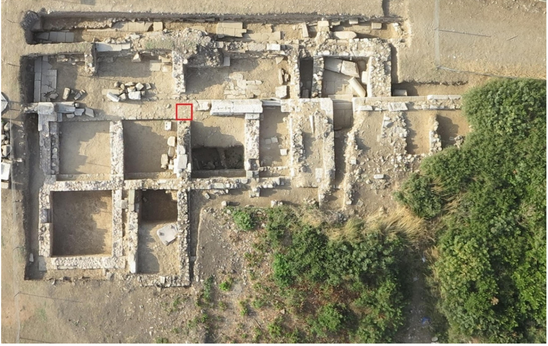
Figür 2: Parion Agora Dükkanlar Yapısı ve Bizans kurşun mührünün buluntu yeri (Parion Kazı Arşivi).

dönemlerde yeni duvarlar eklenmiştir. Bu duvarların mimari özellikleri, kazı çalışmalarında ele geçen seramikler 18 ve sikkeler 19 yardımıyla MS 3.-4. yüzyıllarda inşa edildiği düşünülmektedir. Agora ve Dükkanların, MS 5.-6. yüzyılda yeni eklemelerle kullanıldığı hem kazı çalışmalarında ortaya çıkarılan farklı tekniklerdeki duvarlar hem de seramik 20 , sikke 21 ve metal 22 gibi buluntuların yardımıyla anlaşılmaktadır. Yapıdaki kazılarda ele geçen basit bir şekilde çamur harçla inşa edilmiş duvar kalıntılarının yanı sıra sikke 23 ve seramik 24 gibi buluntuların da yardımıyla yapının son kullanım evresinin MS 11.-12. yüzyıl olduğu söylenebilir 25 .