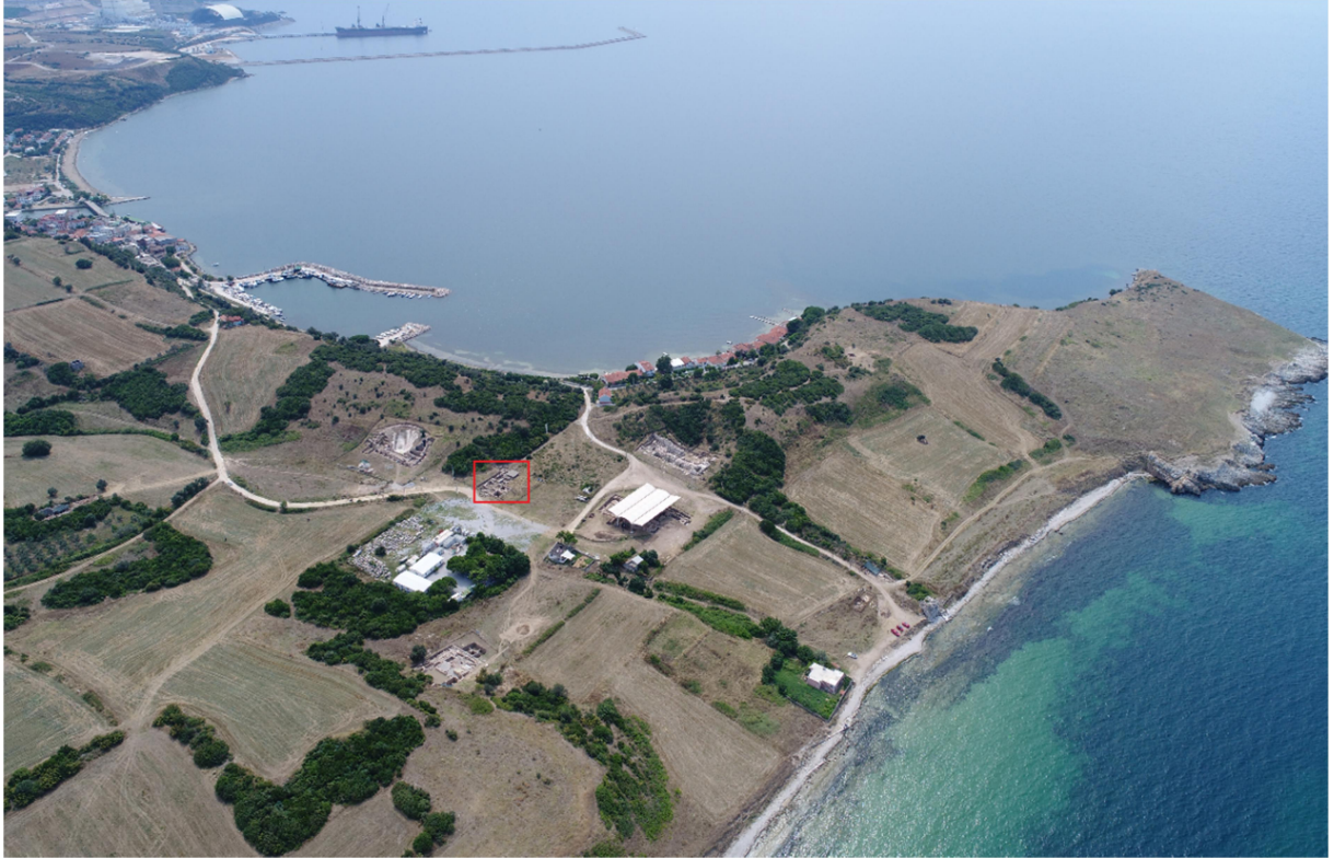
Figür 1: Parion antik kenti ve Agora Dükkanlar hava fotoğrafı