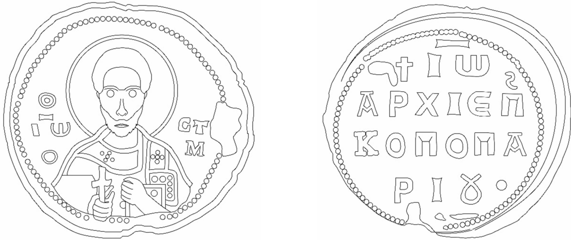
Figür 4: Parion Başpiskoposu Ioannes'in kurşun mührünün çizimi (Çiz. H. Öztürk)