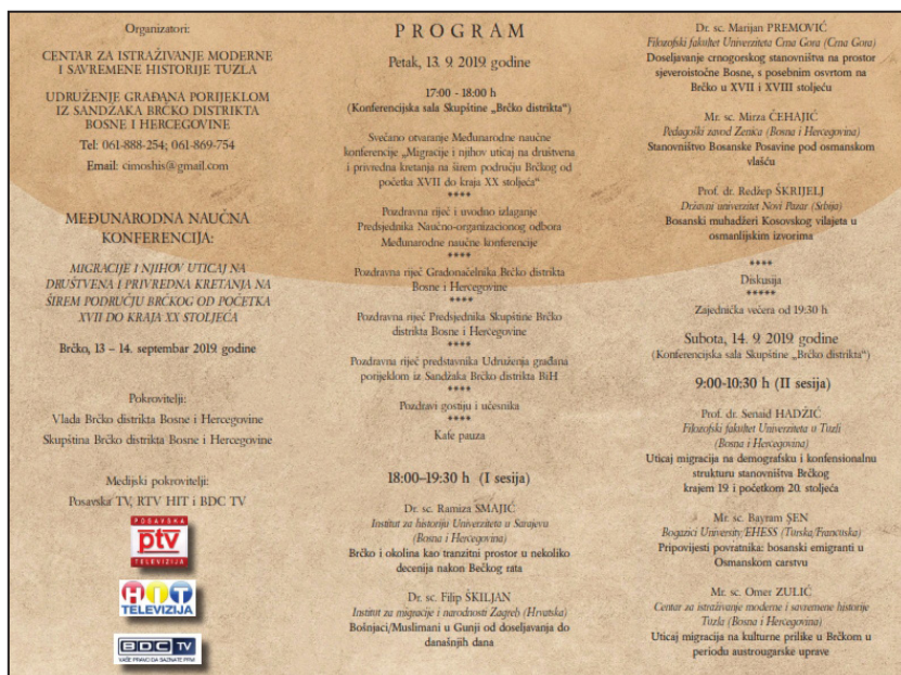
Prilog 1. Program Međunarodne naučne konferencije Migracije i njihov utjecaj na društvena i privredna kretanja na širem području Brčkog od početka XVII do kraja XX stoljeća , Brčko, 13. i 14. septembra 2019. godine.