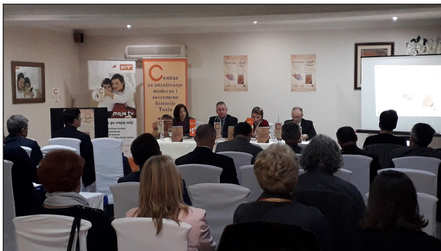
Prilog 4. Detalj sa Naučne manifestacije "Historijski pogledi 2", Tuzla, 8. i 9. novembar 2019. godine.