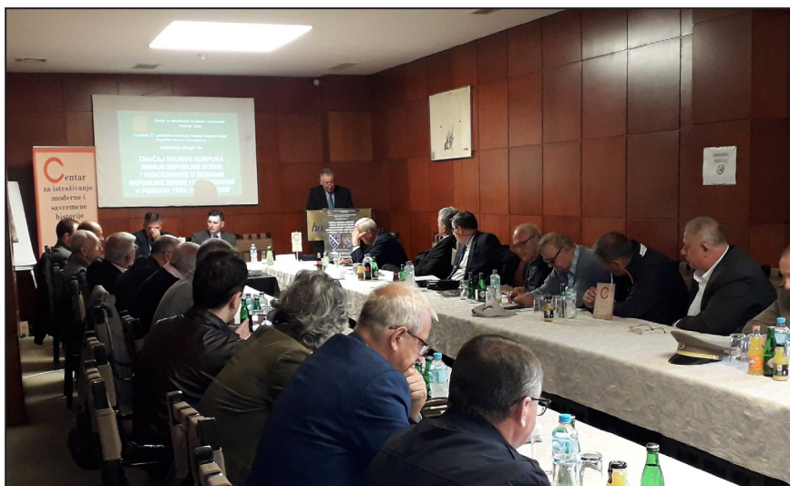
Prilog 3. Detalj sa Okruglog stola "Značaj Drugog korpusa ARBiH u odbrani Republike Bosne i Hercegovine u periodu 1992-1995. godine".

Kako je istaknuto tom prilikom, značaj Drugog korpusa u posljednjem ratu je ogroman, ali mu se ne pridaje dovoljno pažnje. Podsjetili su da je Drugi korpus odbranio najveću teritoriju Bosne i Hercegovine, da je imao najveći broj boraca i da je iznjedrio 3 heroja. U historiografiji do sada nije dobio adekvatnu pažnju, zbog čega je značaj održavanja okruglog stola poseban. Pored toga, učesnici smatraju da je potrebno činjenice iz prošlog rata prenositi i mlađim generacijama, učenicima osnovnih i srednjih škola, kao i studentima, jer se u nastavnim planovima i programima poklanja nedovoljno pažnje tom periodu.