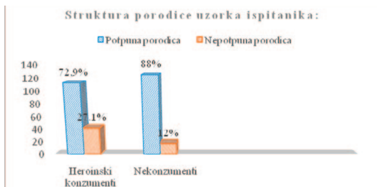
Slika br.1. Grafički prikaz porodične strukture za kliničku i kontrolnu skupinu ispitanika

Kada je riječ o porodičnom okruženju, karakteristike koje su bile u fokusu ovog istraživanja su potpunost porodice te bihevioralni obrasci roditelja – sklonost roditelja konzumiranju alkohola te sklonost roditelja agresivnom ponašanju. U uzorku heroinskih ovisnika, njih 113 potiče iz potpunih porodica, dok ih je 29 odraslo sa majkom, 4 sa ocem, 5 bez roditelja i 4 kod staratelja. Zbog malih frekvencija pojedinih kategorija struktura porodičnog okruženja je podijeljena na potpunu i nepotpunu, pri čemu u kategoriju nepotpune porodice pripadaju ispitanici bez majke ili oca, bez roditelja i oni koji su odrasli sa starateljima. Identično spajanje kategorija načinjeno je i za kontrolni uzorak ispitanika. U skupini nekonzumenata, njih 113 je odraslo u potpunoj porodici, 29 sa majkom, 4 sa ocem, 5 bez roditelja i 4 kod staratelja. Grafički prikaz strukture kliničkog i nekliničkog uzorka s obzirom na strukturu porodičnog okruženja prikazan je na slici br.1.