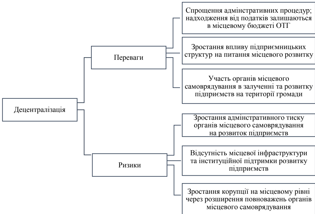
Рис. 1. Переваги та потенційні ризики впливу децентралізації на розвиток виробничих підприємств в об'єднаних територіальних громадах Джерело: власні дослідження.