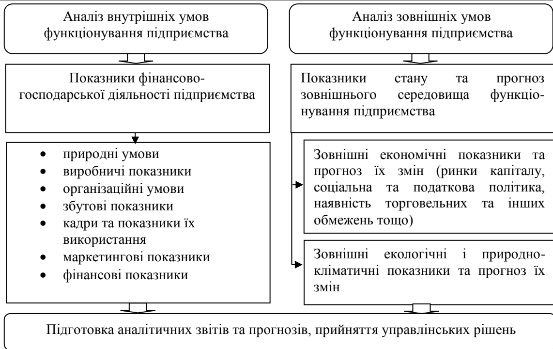
Рис. 1. Система показників для розрахунку аналітичних звітів та прогнозів