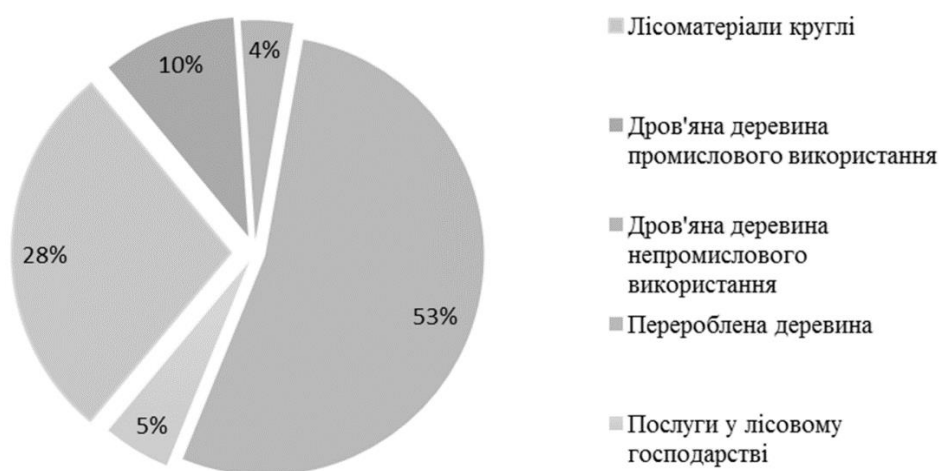
Рис. 3. Структура реалізації продукції на підприємстві у 2019 р.

Показники виробництва та реалізації продукції є основними індикаторами стану самого підприємства, а також впливу на нього чинників внутрішнього та зовнішнього середовища існування. Особливо слід зупинитися на тому, що ведення лісгосподарської діяльності підприємств визначають природно-кліматичні та екологічні фактори. І саме доступ до інформації, що забезпечувала б обґрунтовані прогнози зміни названих чинників, здатні вплинути на управлінські рішення та стратегічні плани підприємств.