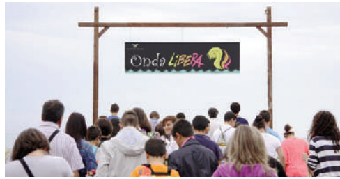
Figg. 18, 19 | Lido Onda Libera in Scanzano Jonico, designed by M. Leuzzi, 2015 (credits: M. Leuzzi, 2015).