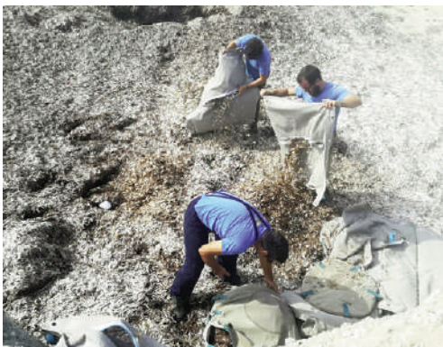
Figg. 1-3 | Medonia, beached Posidonia Oceanica banquettes, storage phase of collected and dried biomass, beach bag emptying operations at the end of the bathing season, Favignana, 2016.

di incentivare l'incremento della balneazione aumentando la ricezione turistica; tutelare le risorse naturali attraverso azioni ascrivibili alla relazione tra design per il territorio e design sociale; realizzare e testare prodotti per l'arredo spiaggia progettati a partire da requisiti ambientali a carattere locale; sperimentare artefatti industriali nell'ambito del design di prodotto. In termini operativi, successivi al progetto e alla prototipazione, si è proceduto con l'installazione sulle spiagge di Favignana, e il successivo monitoraggio per i mesi estivi, di 'telai balneari' (Fig. 4) composti da montanti in legno assemblati tramite incastri e cunei a secco e un equipaggiamento di sacche, per il contenimento del-