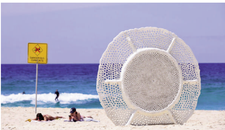
Figg. 13-15 | Sculpture by the Sea , Bondi Beach, Sydney since 1997 (credits: Sculpture by the Sea Incorporated, 2021).