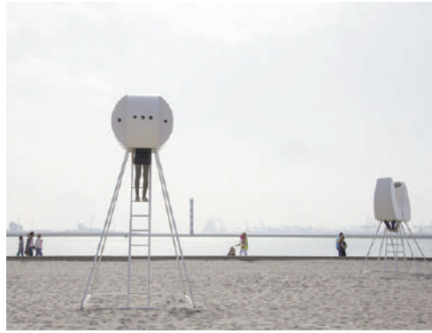
Figg. 16, 17 | Heads in Hoek van Holland designed by R. Sweere, 2014 (credits: R. Sweere, 2014).