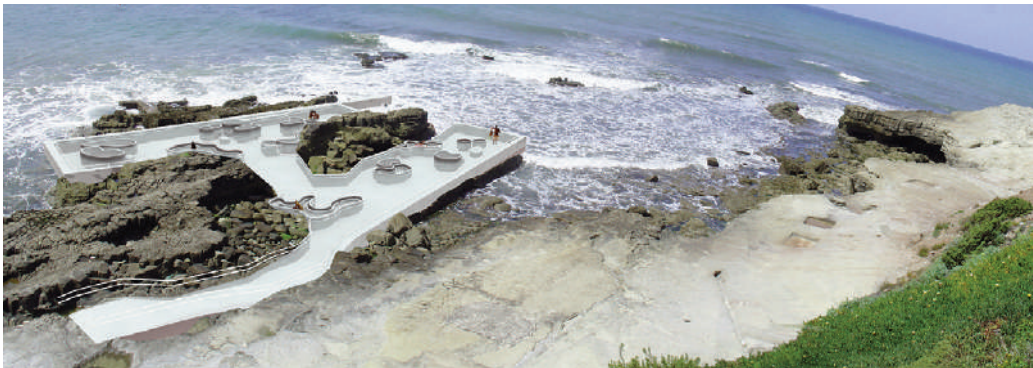
Figg. 20, 21 | Sea Bathing Facility in Lourinhã (Portugal), designed by C. Mourao Pereira, 2007 (credits: C. Mourao Pereira, 2007).

leads us to speculate on the fact that this is a term with a usefully transformist content, however, to be freed from the possibility of being completely bound to words that give it a very specialized vision. Among these, paradoxically, the word 'development' appears, especially when it