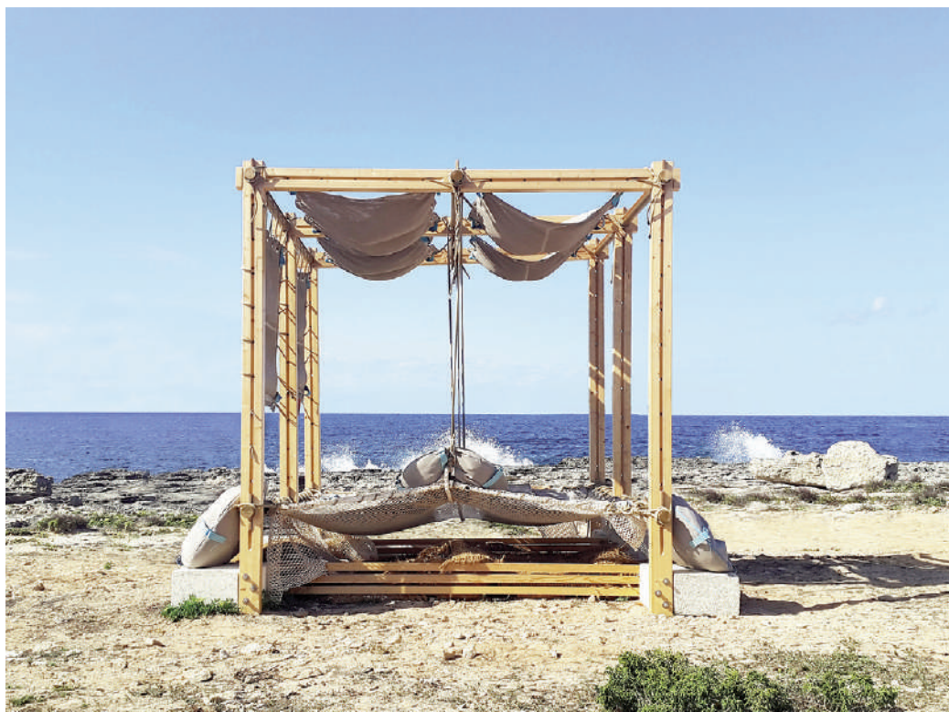
Fig. 4 | Medonia, beach frame in Favignana 2016, designed by V. Cristallo, C. De Simone and S. Cappucci.

Conclusioni | La rigenerazione e la sua più prossima declinazione, ovvero la sostenibilità, offrono un'ampiezza di significati e di linguaggi, anche sofisticati, spontaneamente complessi (Cresci, 2018). Questa considerazione, al netto di quanto fin qui stilato, ci induce a speculare sul fatto che si tratti di un termine dai contenuti utilmente trasformisti, tuttavia da liberare dalla pos-