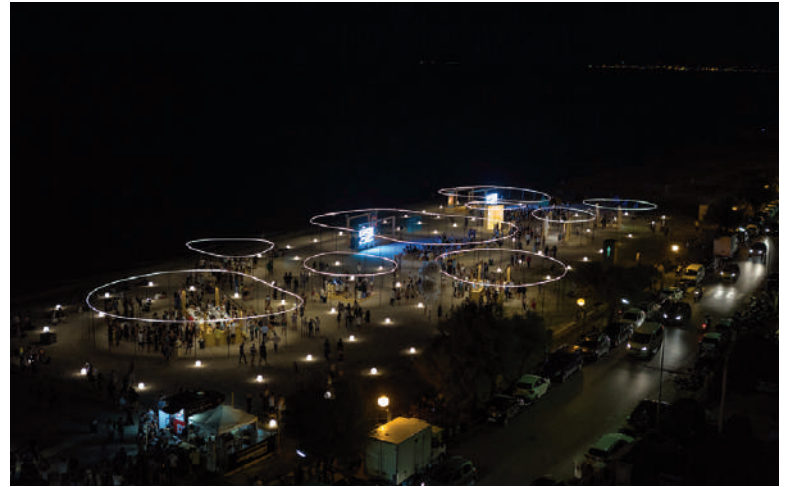
Figg. 11, 12 | Demanio Marittimo – Km-278 in Senigallia designed by C. Colli and P. Ciorra, from 2010.

private content. A habitat in which, in the habit of a mostly sandy surface, cabins as surrogates of dwellings, and beach umbrellas, deckchairs and sunbeds materialize as archetypes of a domesticity in continuous mutation. An exemplary collection of the changing of social habits, of personal and collective needs, of technological innovation (Cristallo, 2020). Both researches – in their evident integration on the level of the ‘research questions’ that have presided over their start and accompanied their development, and which are described here only in their main features – give the possibility of outlining for the beach environment a selective planning that can be traced back to the themes of regeneration, which attributes to Medonia the meaning of direction and to Spiaggiaverde the rhetorical place from which to draw the set of specific case studies.