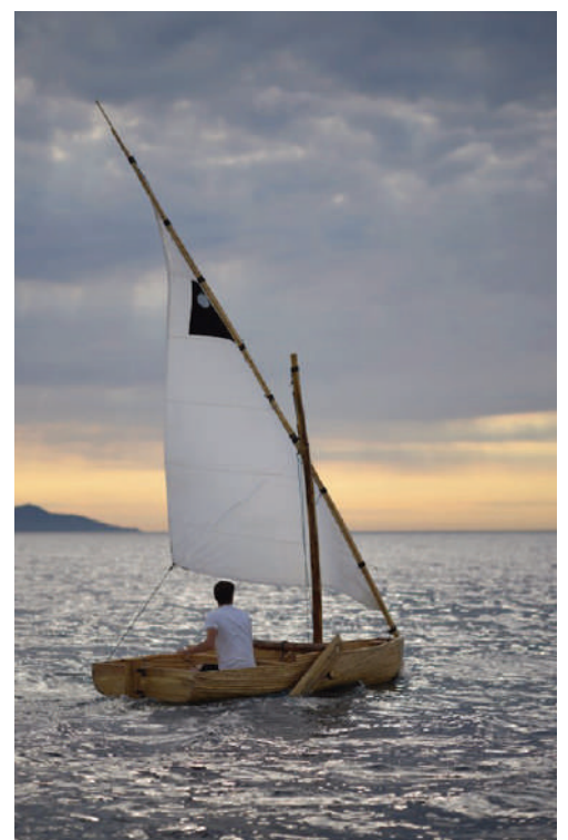
Figg. 8-10 | Plein Soleil in Hyères designed by A. Boudin, 2014 (credits: A. Boudin, 2014).