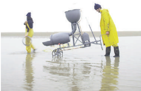
Fig. 5-7 | Sea Chair designed by Studio Swine and K. Jones, 2012 (credits: Studio Swine, 2012).

sibilità di essere del tutto vincolato a parole che ne danno una visione oltremodo specialistica. Tra queste paradossalmente compare la parola 'sviluppo' soprattutto quando si veste di una verticale tautologia trascurando quanta circolarità, anche imperfetta, vi deve essere nel poter accogliere le mutazioni del possibile rapporto tra uomo e natura.