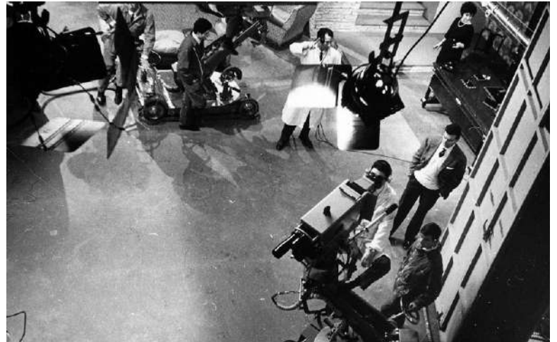
Fig. 2 | 'Le acque della luna', directed by M. Lanfranchi (1962), from a play by N. C. Hunter (1951), is the first prose work realised in RAI studios in Naples, Studio 1, broadcasted on January 5th.