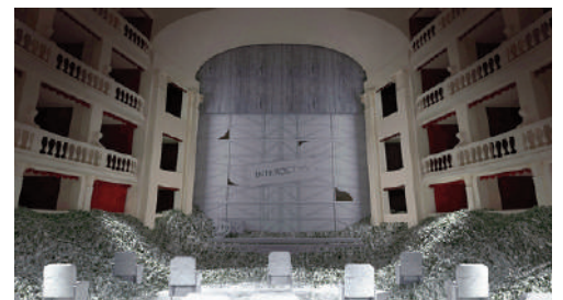
Fig. 6 | Fabbricone, hall, MET, Prato, 2020.