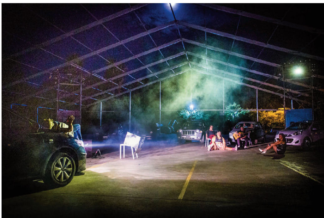
Fig. 13 | 'Pandemic Theatre #1', scenic project, E. Sinisi, 2020.