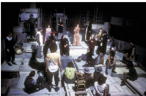
Fig. 1 | 'Candelaio' by G. Bruno, directed by L. Ronconi, scenography by G. Montonati, 2000 (credit: M. Norberth; courtesy: Piccolo Teatro di Milano Archive).

Molti teatri hanno acquisito alti livelli di sicurezza modificando l'assetto interno con riduzione dei posti. Il MET di Prato – un sistema di luoghi creato per il Laboratorio di Ronconi a fine anni '60 – ha riconfigurato la sala del Metastasio in un salotto teatrale con tavolini circolari alternati alle poltroncine (Fig. 5), preferendo una nuova 'normalità' di 220 posti alle 'cicatrici' di un'emergenza. Le poltrone eliminate (140) sono state riposizionate sulla gradinata del Fabbricone (Fig. 6), mentre lo spazio del Magnolfi