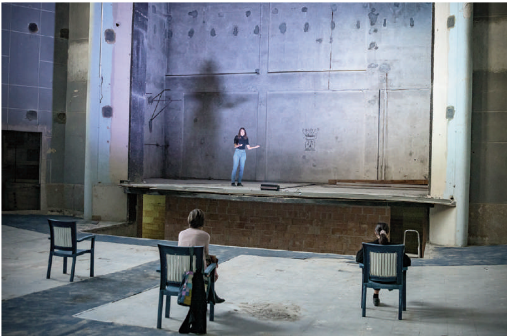
Fig. 9, 10 | 'Senza quinte né scena' by Muta Imago, ex GIL, Forlì, Festival IPERCORPO 2020.

al, nor that it is a fairy tale, but it means knowing with certainty that an enormous amount of very real decisions first made it possible, then almost invoked it, then generated definitively by assembling it with an infinite number of small and large practical behaviours (Baricco, 2021).