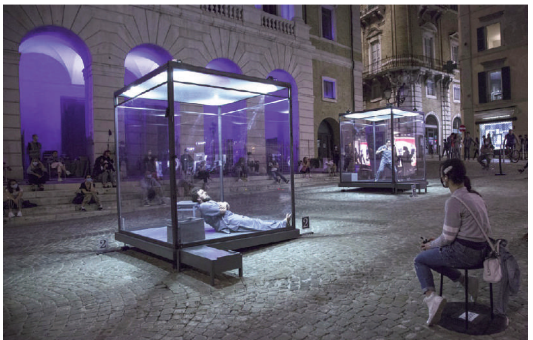
Fig. 11 | 'L'attore nella casa di cristallo' written and directed by M. Baliani, concept by V. Papa, set design by L. Diana, Ancona, square in front of Teatro delle Muse, Marche Teatro, 2020 (credit: A. Cecchi).