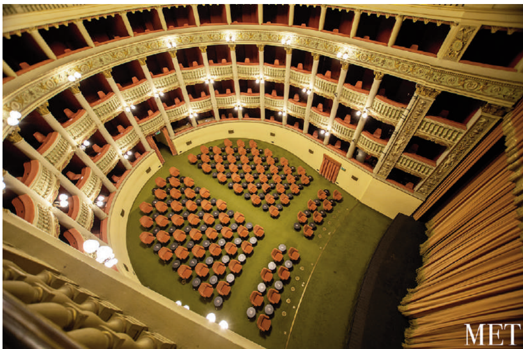
Fig. 4 | 'Per voci sole', Greek Theatre of Syracuse, INDA season 2020 (credit: M. P. Ballarino; courtesy: AFI, INDA archive).