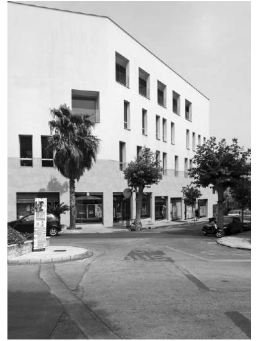
Fig. 7 | MellusoArchitettura, Fondazione Musarra Onlus, Capo d'Orlando, Italy, 2016 (credit: N. Culotta).

rendous appearance of unfinished constructions' (Germanà, Mamì and Perricone, 1999). One hundred and twenty-seven unfinished buildings were identified in Palermo following extensive reconnaissance work, based on the analysis of aerial photos and subsequent site visits. Although this sample might seem restricted, it still offers interesting general insights (Fig. 3). The period for building construction confirms the feature highlighted above at the national level; only 7% of the unfinished buildings were built after the year 2000. Looking at the intended original use and ownership, the sample shows that unfinished public buildings are actually in a minority: only 5% compared to 22% private; as many as 73% were confiscated from organized crime (a most particular category of real estate, the destination of which, after confiscation, is determined by the National Agency for Seized and Confiscated Assets). 6