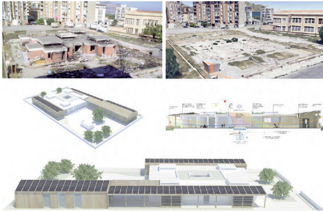
Fig. 4 | Kindergarten in the Sperone district of Palermo, built at the end of the 1970s in a framework of a social housing district; after decades of abandonment and illegitimate use, it was demolished in 2019, providing an emblematic example of ‘repairing demolition’. The condition of abandonment before demolition; The clean slate resulting from the demolition; Design hypothesis by F. Bianco, P. Bruno and L. Di Marco (graphics by F. Anania).

in very different contexts, such as Morocco, Turkey, Taiwan, Spain, Portugal and the United Arab Emirates (Fig. 1). 1