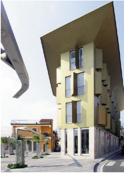
Fig. 5 | Gambardellarchitetti, Palazzo D'Oro, Montesarchio, Italy, 2004.