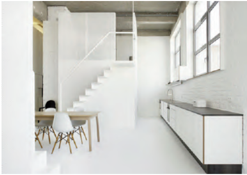
Fig. 15 | adn Architectures, Loft FOR, Bruxelles, Belgium, 2013.

ing marking the entrance to the city with its golden mantle and a large cornice (Fig. 5). The MellusoArchitettura studio's method as applied in a completion project for a semi-detached dwelling in Caronia Marina (Fig. 6) and the Musarra Onlus Foundation headquarters in Capo d'Orlando (Fig. 7) seems similar to the one mentioned above; both projects were carried out in the province of Messina, in 2005 and 2017 respectively. Nothing, or hardly anything, seems to hint at the temporary suspension of time endured by the constructions in question: massive, white-plastered blocks, partly covered with black ceramics or stone, bring distinction to spaces in an advanced state of neglect and to contexts that mostly lack building quality.