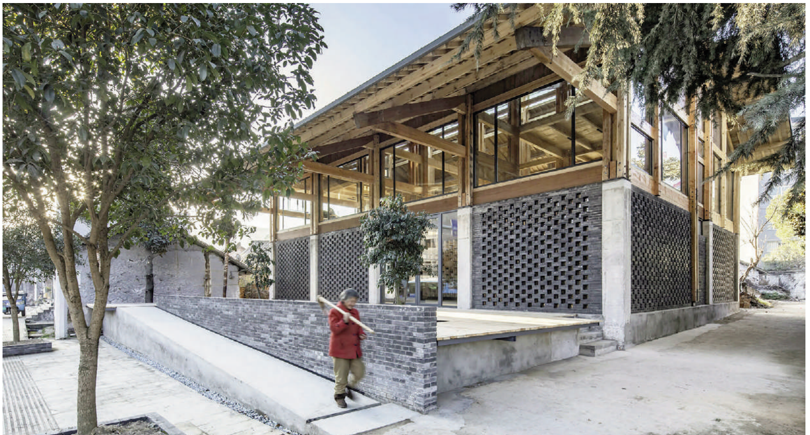
Fig. 12-14 | LUO Studio, Party and Public Service Center, Shiyan, China, 2019 (credits: LUO Studio; Weiqi Jin).