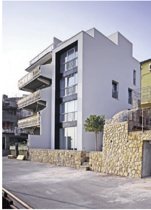
Fig. 6 | MellusoArchitettura, Row semidetached dwelling, Caronia Marina, Italy, 2005.