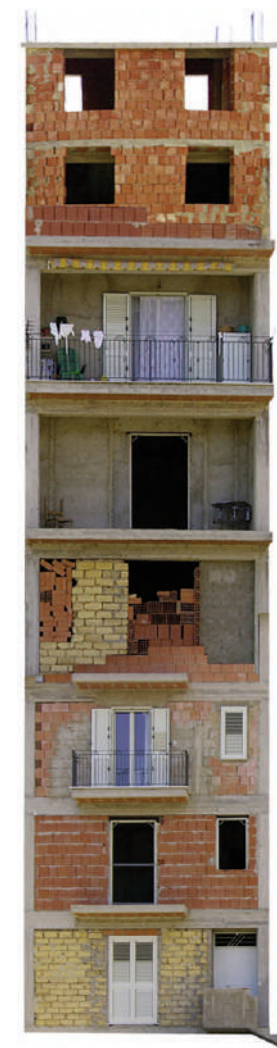
Fig. 2 | Construction 01, Digital collage 2011; Construction 03, Digital collage 2011 (credits: C. Nicotra).