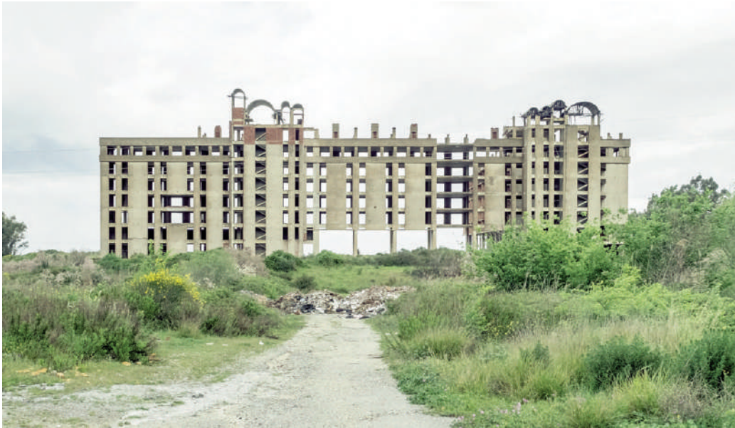
Fig. 1 | Unfinished building in Zeytinköy, Turkey.

costruzioni incomplete ha assunto i contorni di un'emergenza che richiede di essere affrontata con uno specifico approccio progettuale, in quanto si tratta di accostarsi a interventi non riconducibili a nessuna categoria tra quelle abituali, non essendo né ex novo, né di recupero propriamente detto. Infatti, passando dal livello programmatico alla dimensione progettuale, ancora mancano circostanziate indicazioni metodologiche per l'intervento sull'incompiuto; per questo, sarebbe opportuno individuare orientamenti e criteri generalizzabili, che possano rivolgersi al maggiore numero di vari portatori di interesse, adattandosi alle specifiche