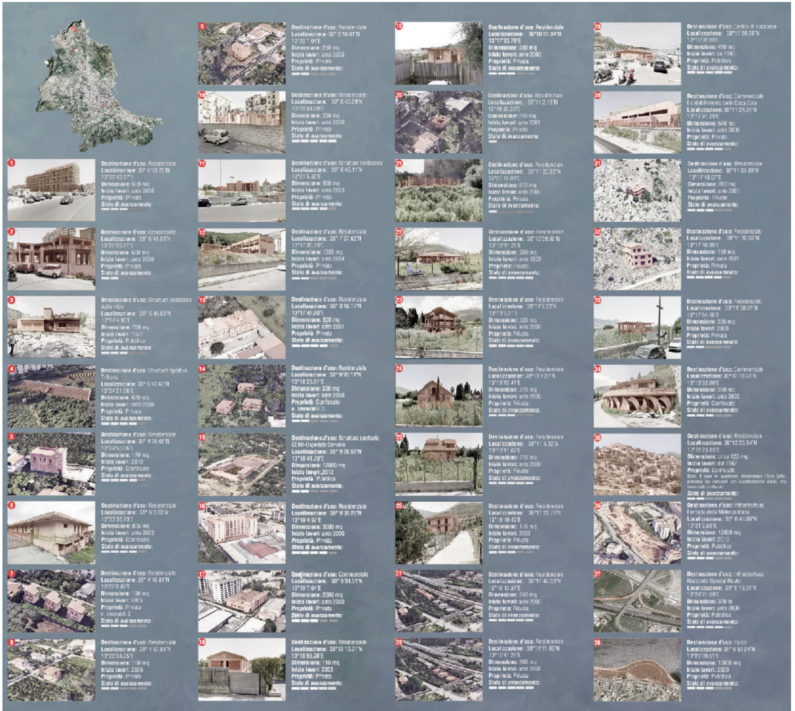
Fig. 3 | Survey of unfinished buildings in the City of Palermo dated September 2020.

Considering the variety of wide-ranging and widespread examples, the unfinished building phenomenon poses a significant research problem affecting public and private stakeholders, who are directly involved as clients with regard to the original building process, either as administrators or owners of the present building. However, the range of stakeholders extends to the social dimension, if we consider that the effects of each construction activity «[...] constitute a value for the community because of the potential benefits in economic, environmental and social terms» (UNI, 1998, p. 1), since every single building entails various consequences for landscape, use of natural resources, well-being and the safety of all.