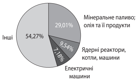
Рис. 3. Основні групи товарів у товарній структурі імпорту України

Визначальною сферою відносин між Україною та країнами Східної Азії є зовнішньоторговельне співробітництво. Останнім часом тенденція до збільшення зовнішньої торгівлі між країнами, що мають негативне сальдо в торгівлі товарами, стабільна. Обсяги імпорту з азійських країн перевищують обсяги експорту з України, аналіз товарної структури доводить її екстенсивний характер, що проявляється в