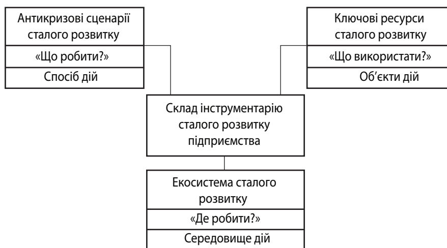
Рис. 1. Інструментарій сталого розвитку підприємства в умовах кризи

Отже, інструментарій сталого розвитку підприємства в умовах кризи пов'язано описує об'єкти, предмети, способи та середовище майбутніх дій під-