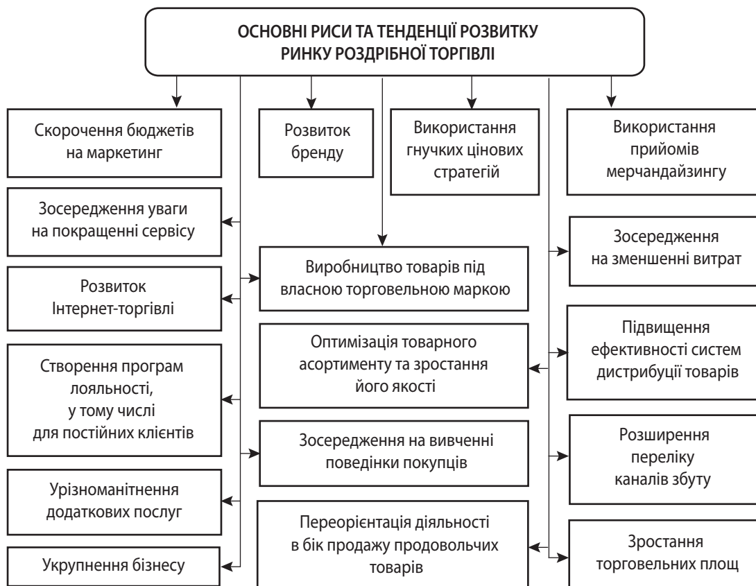
Рис. 1. Основні риси та тенденції розвитку сучасного ринку роздрібно́ї торгівлі