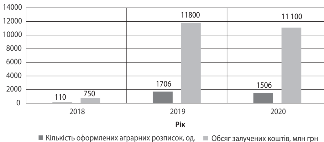
Рис. 1. Динаміка кількості аграрних розписок та обсягів коштів, залучених з їх використанням, станом на початок відповідного року

Дані рис. 2 вказують як на зростання вартості оборотних активів упродовж 2018–2019 рр., так і на їх