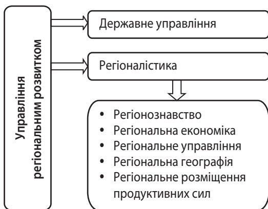
Рис. 1. Напрями досліджень у сфері управління регіональним розвитком

Викладення результатів дослідження. Усю сукупність наукових напрямків у сфері регіонального розвитку наведено на рис. 1 .