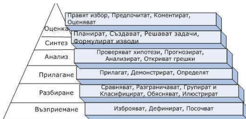
Фиг. 1. Йерархична подредба на таксономията на Блум (Тужаров 2009)

Блум представя йерархия на когнитивните процеси, в която по-високите нива на мислене включват всички познавателни умения от по-долните нива (фиг. 1.).