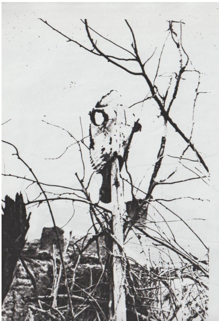
Рис 2. Конский черепа, использовавшийся в качестве оберега.

ICV (Poland) = 6.630 PIF (India) = 1.940 IBI (India) = 4.260 OAJI (USA) = 0.350