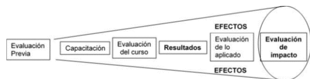
Figura 1. Momentos claves de la evaluación.

En la figura 1 puede observarse cómo se toman momentos previos como referentes: los resultados y los efectos.