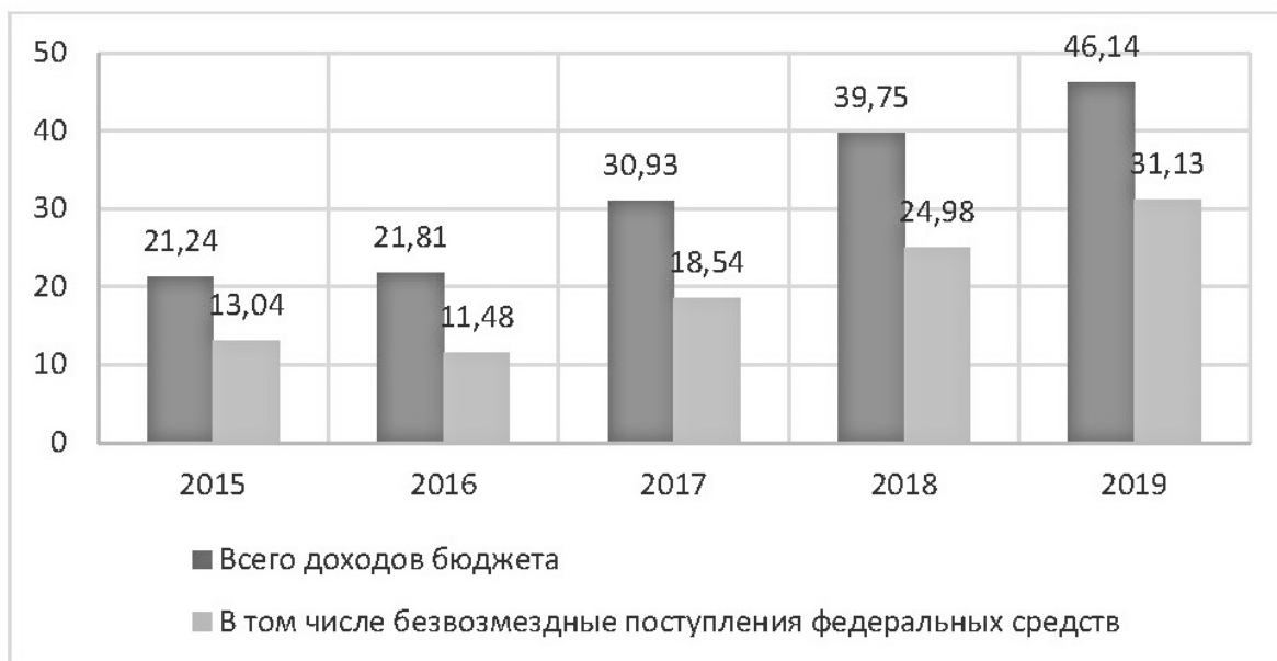
Рисунок 3 – Соотношение доходов бюджета города Севастополь и безвозмездных поступлений из Федерального бюджета в составе этих доходов в 2015–2019 гг.