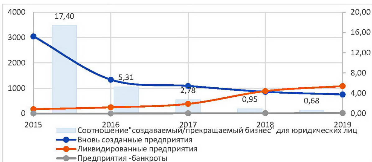
Рисунок 1 – Динамика создания и ликвидации предприятий в Севастополе в 2015–2019 гг.

Банковское обслуживание корпоративных и частных клиентов также существенно осложняется санкциями. Международные платежные системы – Visa, MasterCard, PayPal – прекратили работу в Крыму, а расчеты такими картами, выпущенными материковыми банками, стали возможны только с переводом всех внутрисекторских транзакций Visa и MasterCard на процессинг национальной системы платежных карт. Исключение из системы SWIFT фактически приостановило валютное сопровождение внешнеэкономических операций местными банками. И хотя по большинству позиций банковской системы Севастополь и Крым уже сравнялся со среднероссийскими показателями, полноценной эту систему назвать пока сложно.