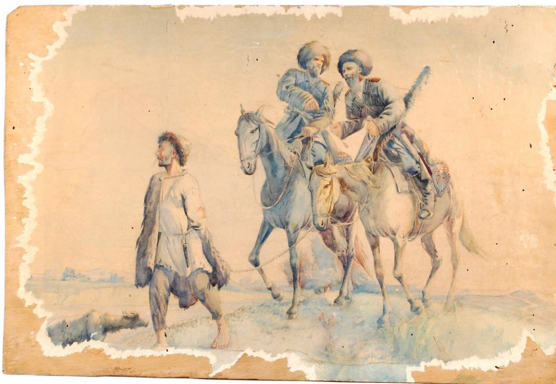
Рис. 1. Арестованный крепостной Мельгошев Мишет за волнение унаут (рабов) в с. Армавире 16 мая 1867 г. Художник Коваленко И.В. Период создания: 1950-е гг. Материал, техника: бумага, акварель, дсп, рисунок. Размер: 65x44 см. Место создания: Майкоп. Номер в Госкаталоге: 21611941. Номер по ГИК (КП): НМРА КП 4727.

Отклики Кавказа. Армавир, 1911. № 43 (24 февраля).