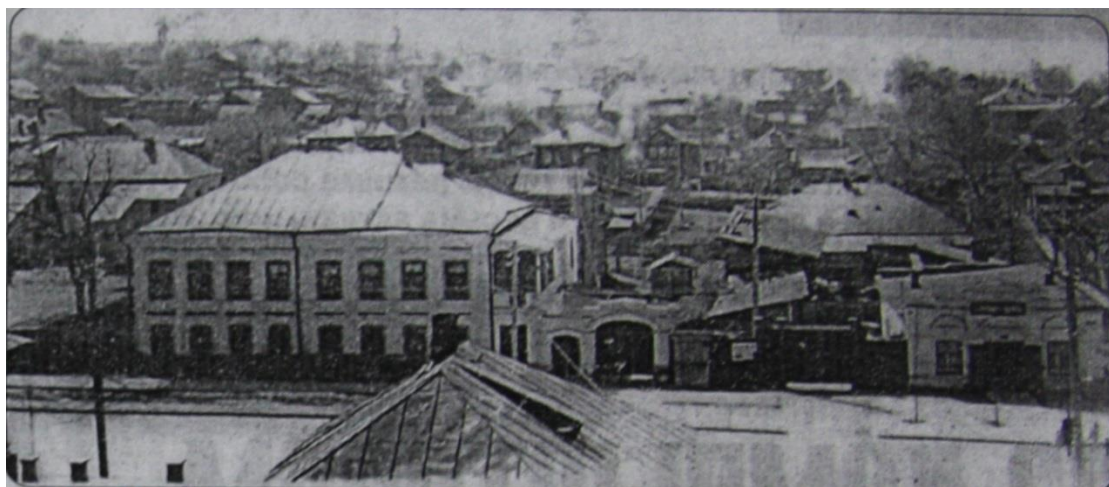
Рис. 4. Двухэтажный каменный дом с воротами по ул. Кирова, 30. Бывший дом священнослужителей Благовещенского собора и рядом бывшая земская аптека.