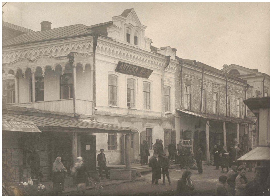
Рис. 8. Улица Базарная, конец 1920-х годов.