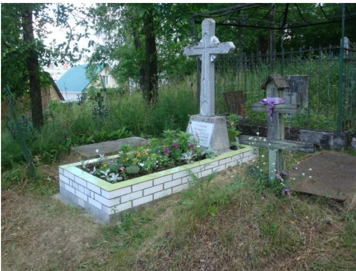
Рис. 9. Могила Н.А. и В.Н. Чернышева. Фото автора, 2017 г.

В 2017 году в Воткинске появилась традиция торжественно отмечать день памяти священномученика Николая Чернышева и его дочери мученицы Варвары праздничной литургией в Благовещенском соборе, и крестным ходом к месту мученической кончины святых 2 января. С каждым годом количество паломников к этому сакральному месту только увеличивается.