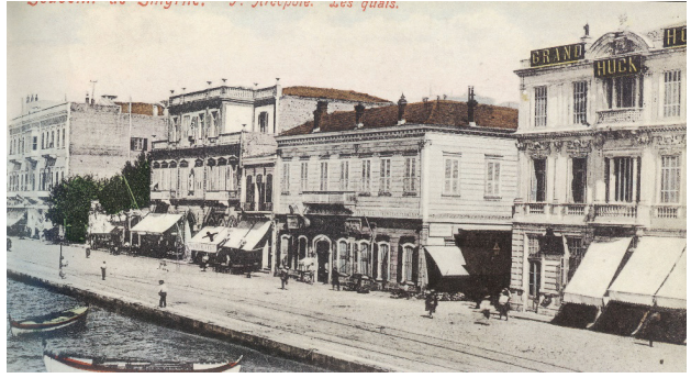
Smyrna Rest, 1880 46

Protestan misyonerler; rıhtımda denizcileri karşılayıp, ellerine tutuşturdukları broşürlerle bir fincan kahve içebilecekleri, gazete, kitap okuyarak dinlenebilecekleri, aynı zamanda Tanrı sözü duyabilecekleri bir ev ortamı sundukları Smyrna Rest ’e davet ederek, İzmir’de yeni bir uygulama başlattılar. İngiliz asıllı bir kadın liderliğinde başlayan faaliyetler, Amerikan misyonerlerinin katılımıyla, akşamları org eşliğinde söyledikleri ilahiler, İncil dersleri ve Pazar ayinleriyle artarak devam etti. Smyrna Rest ’e yolu düşen Batılı misafirlerin hemen hepsi, temiz ve ferah ortamından, masalarda 18 ayrı dilde basılı dini kitaplardan, çokça broşür ve gazeteden, çay, kahve, kakao ikramlarından memnuniyet ve biraz da gururla bahseder. 47 Rumlar ve diğerleri burayı Caffee-Hou-