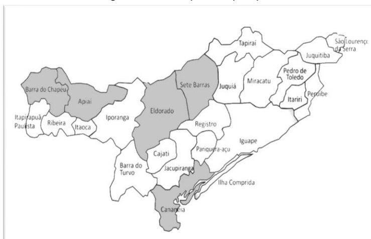
Figura 2 - Municípios da pesquisa