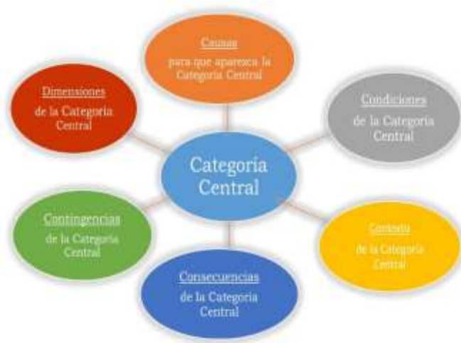
Figura 3. Familia de Códigos Fuente: Charmaz (2006). Adaptado por González (2017).

Contexto de la categoría central; Consecuencias de la categoría central; Contingencias de la categoría central y Dimensiones de la categoría central. Lo anterior se realiza articulando todas las categorías periféricas alrededor de una categoría central, y la explicación de estas articulaciones, la conceptualización procura explicar cómo ciertos conceptos se relacionan entre sí. Ver Figura 3.