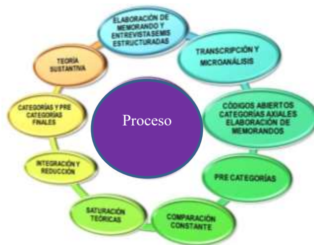
Figura 2. Circular Hermenéutico de la Teoría Fundamentada.

surgidas en torno a una categoría central, lo cual constituirá el esquema de la construcción de nuevos conocimientos. Así mismo exige pensar comparativamente y en términos de propiedades y dimensiones para ver con facilidad que es igual y que es diferente, creando maneras nuevas de comprender el mundo y expresarlas teóricamente, siendo capaz de generar teorías y fundamentarla en los datos, exigiendo la teoría y los datos ser interpretados con indagación sistemáticas. Ver Figura 2.