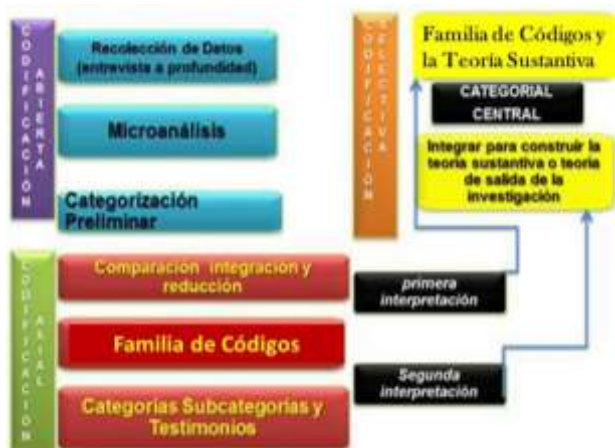
Figura 1. Proceso Analítico de la Teoría Fundamentada

En este sentido, la Figura 1 muestra las diferentes estaciones del proceso de generación de teoría fundamentada. Destaca los procesos de generación de categorías que lo especifica; codificación abierta, codificación axial y codificación selectiva. El proceso se caracteriza por demandar al investigador el tomar decisiones metodológicas lógicas, decisiones sopesadas en profundas reflexiones teóricas. Además de ello, es un método recursivo, flexible y dialógico.