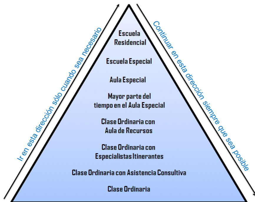
Figura 1. Sistema en Cascada.

A nivel mundial, la Educación Inclusiva ha tenido un panorama desalentador, ya que aunque existen diferentes organismos y organizaciones que abogan y luchan por la inclusión educativa en todos los ámbitos, no solo con personas con discapacidades motoras, física y sensoriales, sino también con aquellos estudiantes de sectores minoritarios que han sido excluidos por distintas causas, tal es el caso de los niños con VIH, los migrantes, los indígenas, entre otros, también es cierto que es necesario una serie de medidas y alternativas para que se cumpla con esta aspiración de derogar la desigualdad y la exclusión educativa.