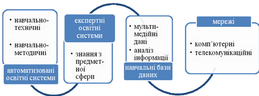
Рис. 2. Система мультимедійних засобів для ефективного оволодіння іноземною мовою

Досліджуючи дидактичне забезпечення процесу вивчення іноземної мови, вважаємо за необхідне розглянути типи мультимедійних засобів для ефективного оволодіння іноземною мовою (рис. 2).