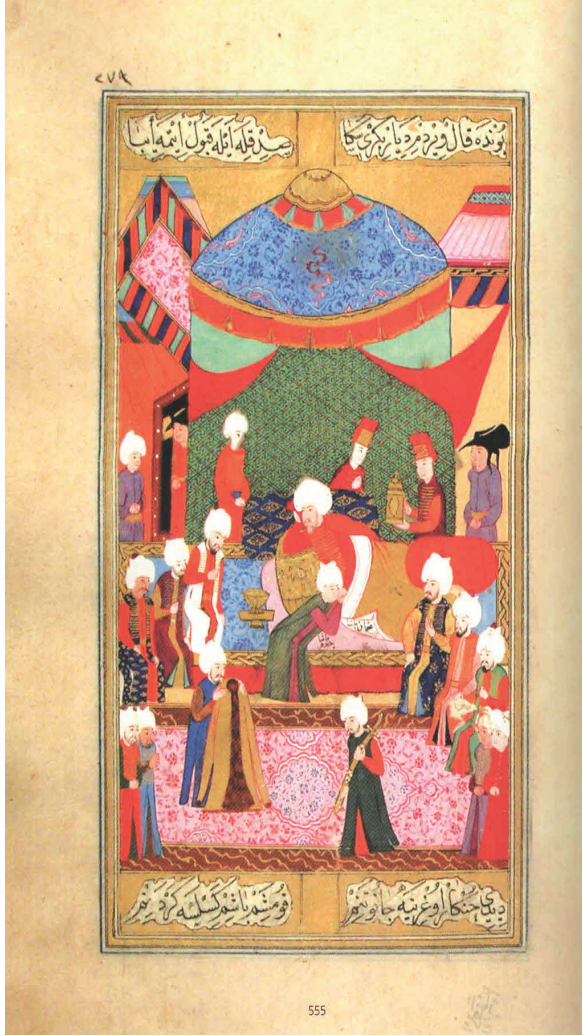
Minyatür 2. Özdemiroğlu Osman Paşa'nın Hadım Cafer Paşa'yı Tebriz Muhafazasıyla Görevlendirmesi, Şecâ'atnâme , İÜ Nadir Eserler Kütüphanesi TY, n. 6043, vr. 279a

Özdemiroğlu Osman Paşa bu tayinden kısa bir süre sonra vefat eder. Ordu- gahta cenaze töreni düzenlenir. Ardından Osmanlı ordusu Cigalazâde Sinan Pa- şa'nın komutasında Tebriz'den ayrılır. Safevi birliklerinin ciddi tehdidi altında ordu ricat ederken aynı şekilde oldukça tehlikeli bir durumda bırakılan Tebriz ve Hadım Cafer Paşa'ya yeteri kadar asker ve levazım takviyesi yapılır. Üç bin beş yüz asker, birkaç yüz darben ve kul mevacibi için akçe şehirde bırakılır. Si-